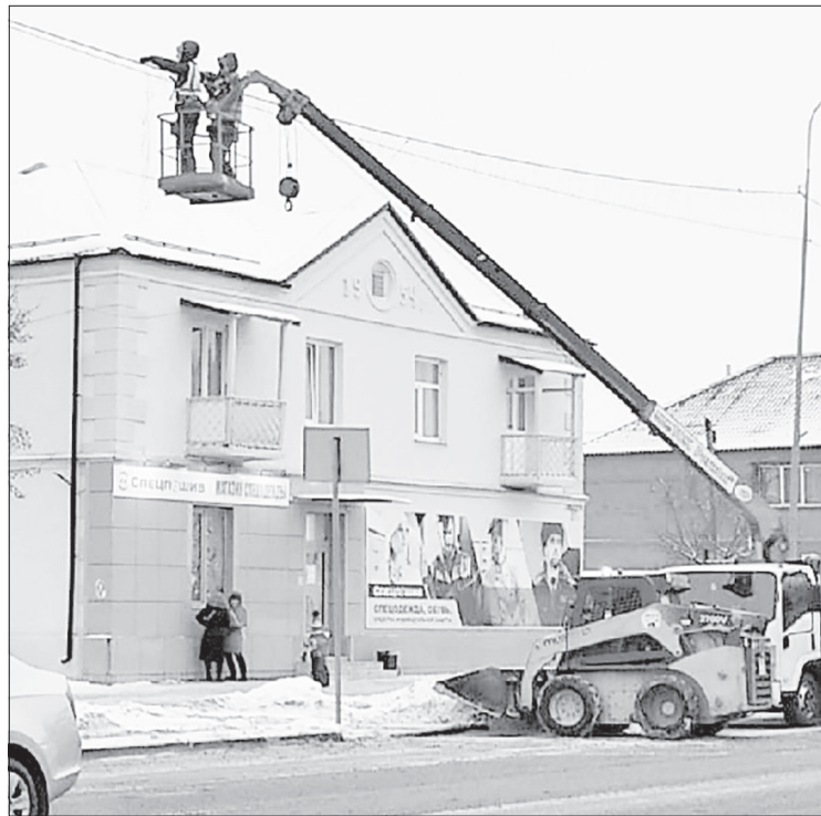
От покупки к празднику новой иллюминации в городе отказались, будут ремонтировать имеющуюся

Самый большой удельный вес в структуре бюджета (если