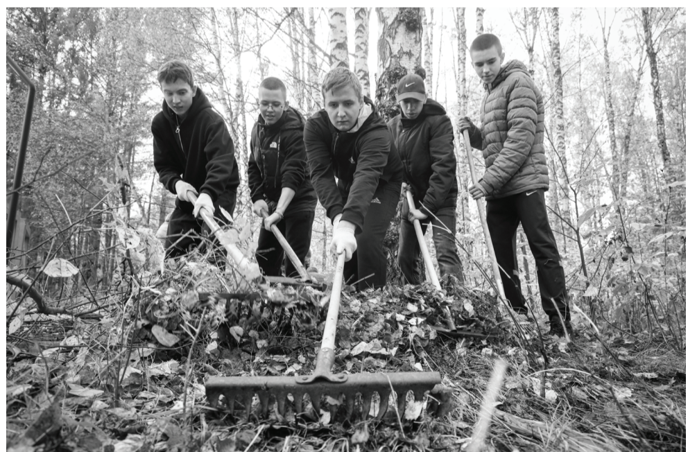
Взрослые и школьники навели порядок в Березовой роще.

— Наш детский сад ежегодно принимает участие в экологической акции, сегодня к ней присоединились семь человек из коллектива, — рассказала заместитель директора детского сада