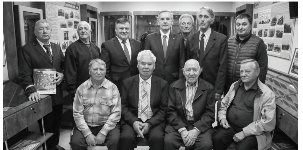
Музей локомотивного депо будет включен в единый с макетом бронепоезда «Патриот» туристический маршрут.

— Издание вышло под эгидой РЖД еще к 70-летию Великой Победы, — сообщил Андрей Артюхов. — Бронепоездов на фронтах воевало около двухсот. Про «Патриот» здесь истории нет, но мы с вами ее хорошо знаем по книге, которую сделали работники Ишимского музейного комплекса имени Ершова.