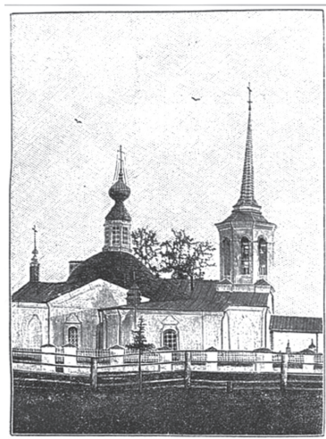
Богородице-Рождественская церковь в г. Берёзово. С фот. И. Д. Носилова грав. Рапесский.

Это уж тобольская фамилия из известных. Среди зачинщиков рода надсмотрщик оружейного двора Никифор Пиленок. Основателем купеческой династии Пиленковых считается Андрей Пиленок, занимавшийся торговлей китайским товаром, возивший сибирскую рыбу на Ирбитскую ярмарку, доставлявший с уральских заводов потребные тобольякам изделия. К XIX веку Пиленковы были одними из главных тобольских богачей, щедро жертвующими на нужды просвещения и на церковь.