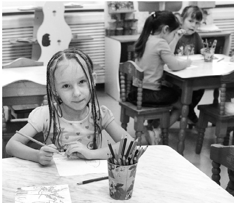
Вагайские ребятишки любят свой детский сад и добрых, отзывчивых воспитателей

Восемь лет назад произошла реорганизация школ сельского поселения. Современное помещение открыло двери для учащихся базовой школы № 37, Вагайской средней и Крутинской восьмилетней школ. Детский сад «Солнышко» стал структурным подразделением МАOU Вагайская СОШ. В пустующем помещении школы № 37 в 2019 году была проведена капитальная реконструкция. После завершения строительных работ детсад переехал в просторные, светлые интерьеры. Проектная мощность детского сада увеличилась до