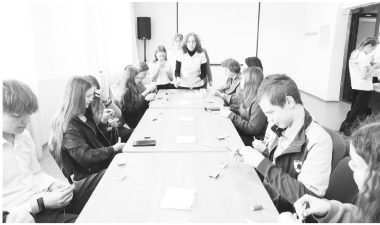
|| Фото Софьи Георгиевой