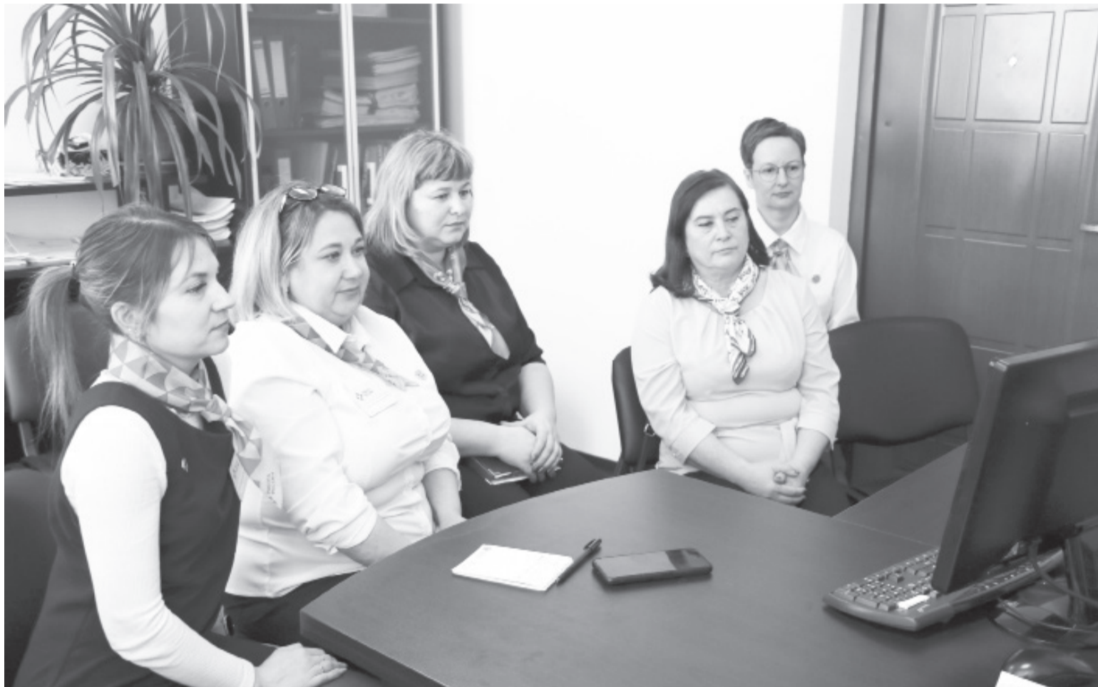
|| Стратегическую сессию Женских клубов провели в режиме видеоконференции.