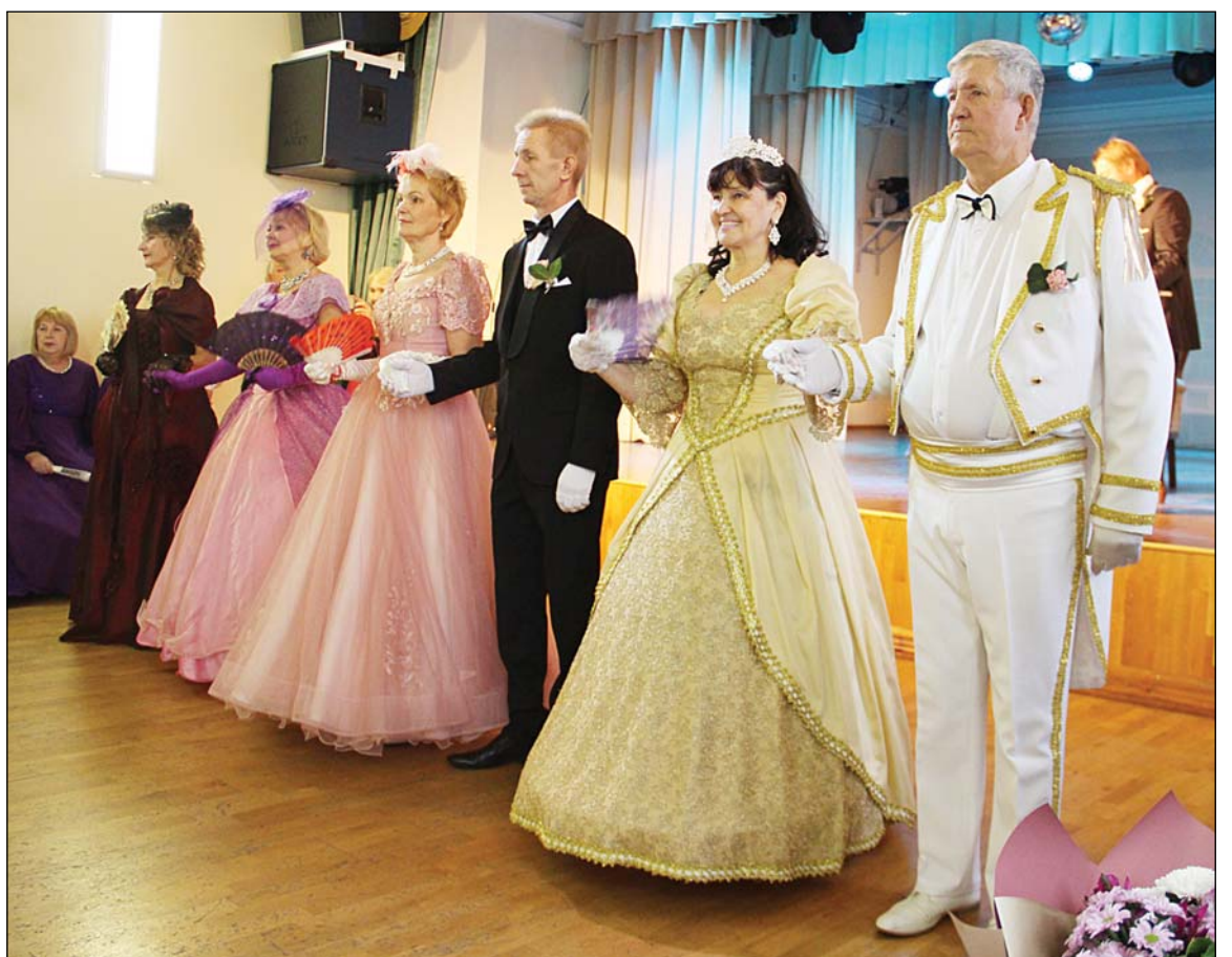
◆ Танцевальный коллектив из областного центра открыл бал «Цветок в петлице».

Участники бала из городов Ялуторовска, Тобольска, Ишима и сёл Нижней Тавды, Исетска, Упорово, Аромашево, посёлка Гольшманово в этот вечер переместились во времена дуэлей и балов, когда мужчины придерживались фразы из кодекса чести русского офицера, составленного в 1804 году, гласившей: «Душа – Богу, сердце – женщине, долг – Отечеству, честь – никому». Присутствующие зарядились позитивом, почувствовали совершенно другой уровень жизни, её изюминку, и может быть, сейчас по инициативе участников бала на территориях начнут разучивать не только линейные танцы, типа зумба, самба и бачата, но и более замысловатые па.