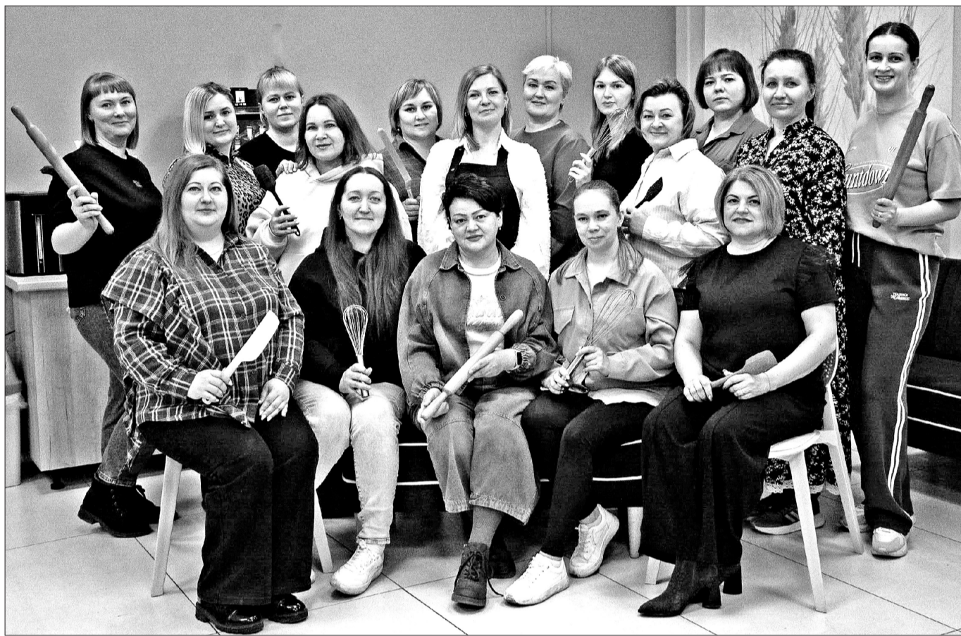
■ «Дружная команда кондитеров сообщества «От сердца к сердцу Заводоуковск» исполняет сладкие мечты особенных ребятшек.

Благотворительность. Заводоуковские кондитеры делают дни рождения детей-инвалидов особенными