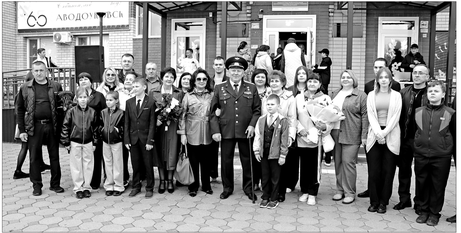
📍 Поздравить Валерия Поташова с открытием на здании Падунской школы информационной доски в его честь собрались многочисленные родственники Героя России.