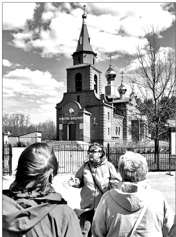
■ Свято-Георгиевский храм в Заводоуковске – знаковая точка в экскурсионном маршруте.