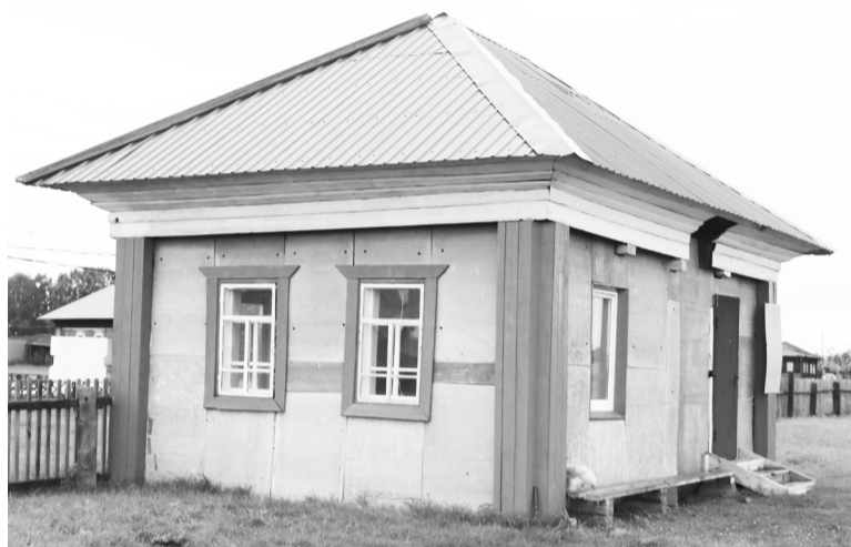
Это тот самый дом, где собираются всем селом, – места всем хватает.