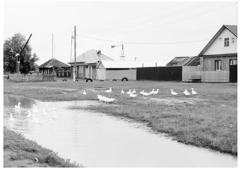
Просто вчера был дождь. Сегодня уткам и гусям настоящее раздолье.