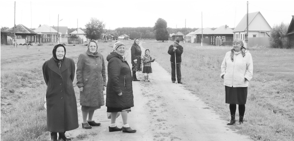
Деревня Ивашкина – в одну улицу, чистая, ухоженная, здесь никогда никто не бросит бутылку и даже фантик от конфеты на обочину.

Это поселение, где сто процентов населения составляют татары, назвали в 1921 году чисто русским именем – вот вам первый парадокс. В самом деле, никакого логического объяснения не найти, как ни старайся