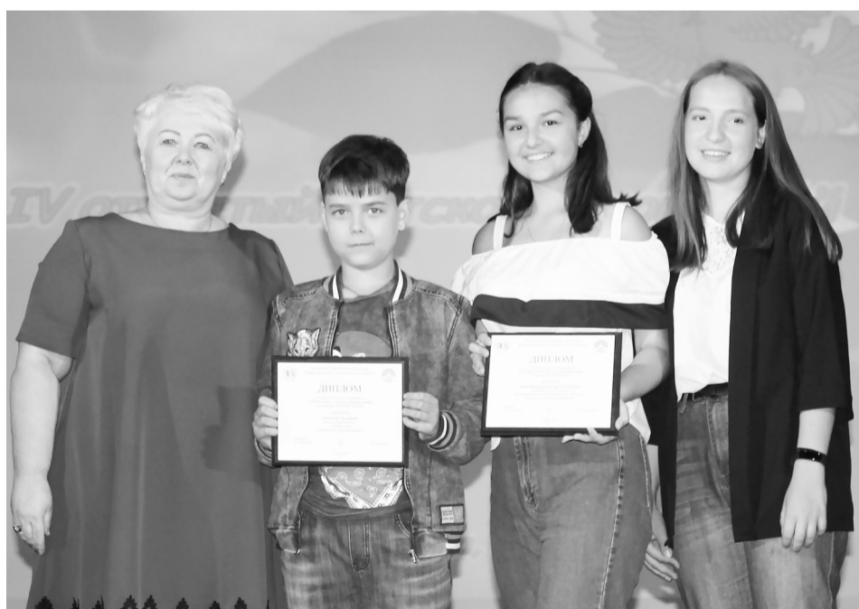
Победители кинофестиваля «Золотая птица».

– Просматривая различные видео в Интернете, я загорелся желанием создать свой ролик. Позже мне рассказали о конкурсе «Золотая птица», и я решил попытаться в нём удачу. В этом году участвую уже в третий раз. Сегодня я стал призёром в номинации «Игровое кино» и получил диплом за лучшую актёрскую работу. Больше всего в процессе съёмки мне нравится быть в кадре и доносить