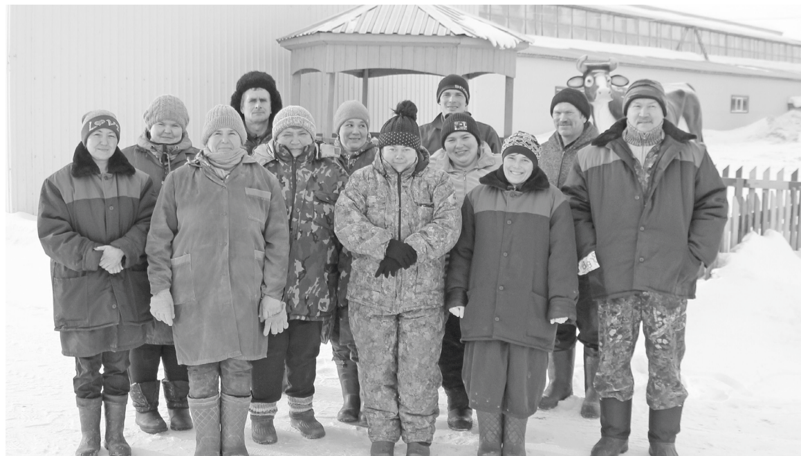
Коллектив Таволжанского отделения СПК умеет справляться с любыми трудностями.