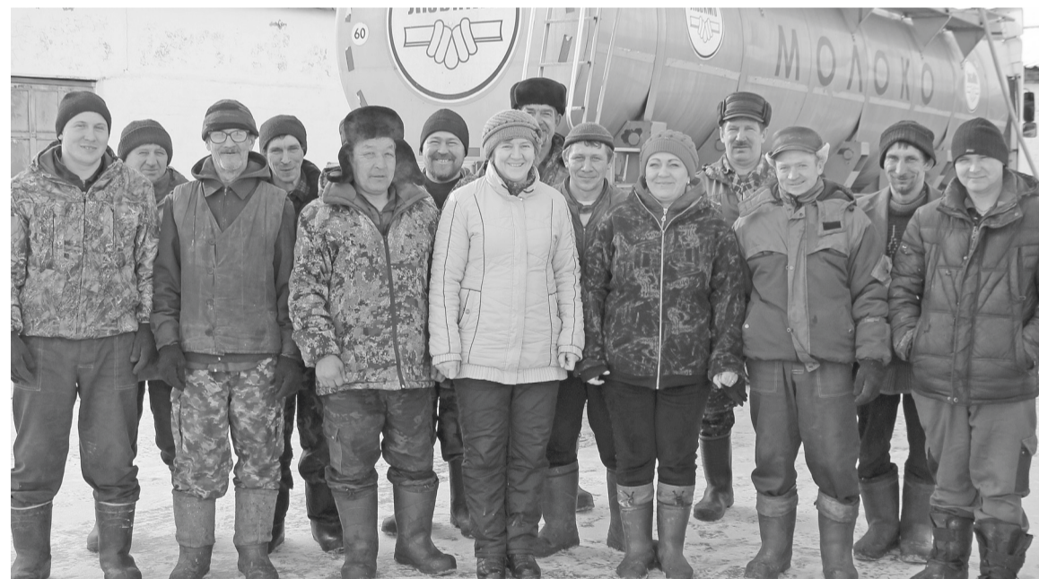
Сотрудники Михайловского отделения СПК достойно выполняют поставленные задачи.