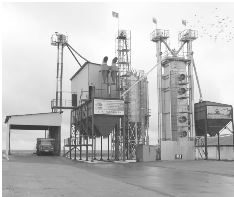
Сортировально-сушильный комплекс кооператива – мощный производственный объект.

важной датой для всего кооператива. От души желаю крепкого здоровья, благополучия, достатка, ежегодных урожаев, высоких уроков, потрясающих привесов! А ещё бесконечного процветания, растущего благополучия и постоянного движения вперёд!