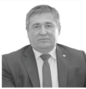
УВАЖАЕМЫЕ РАБОТНИКИ СЕЛЬСКОХОЗЯЙСТВЕННОГО ПРОИЗВОДСТВЕННОГО КООПЕРАТИВА «ТАВОЛЖАН»!

Александр МООР, Губернатор Тюменской области