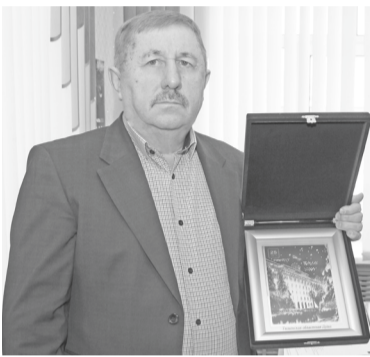
ДОРОГИЕ КОЛЛЕГИ! УВАЖАЕМЫЕ РАБОТНИКИ И ВЕТЕРАНЫ СПК «ТАВОЛЖАН»!

Поздравляю с важным событием – 20-летним юбилеем нашей организации!