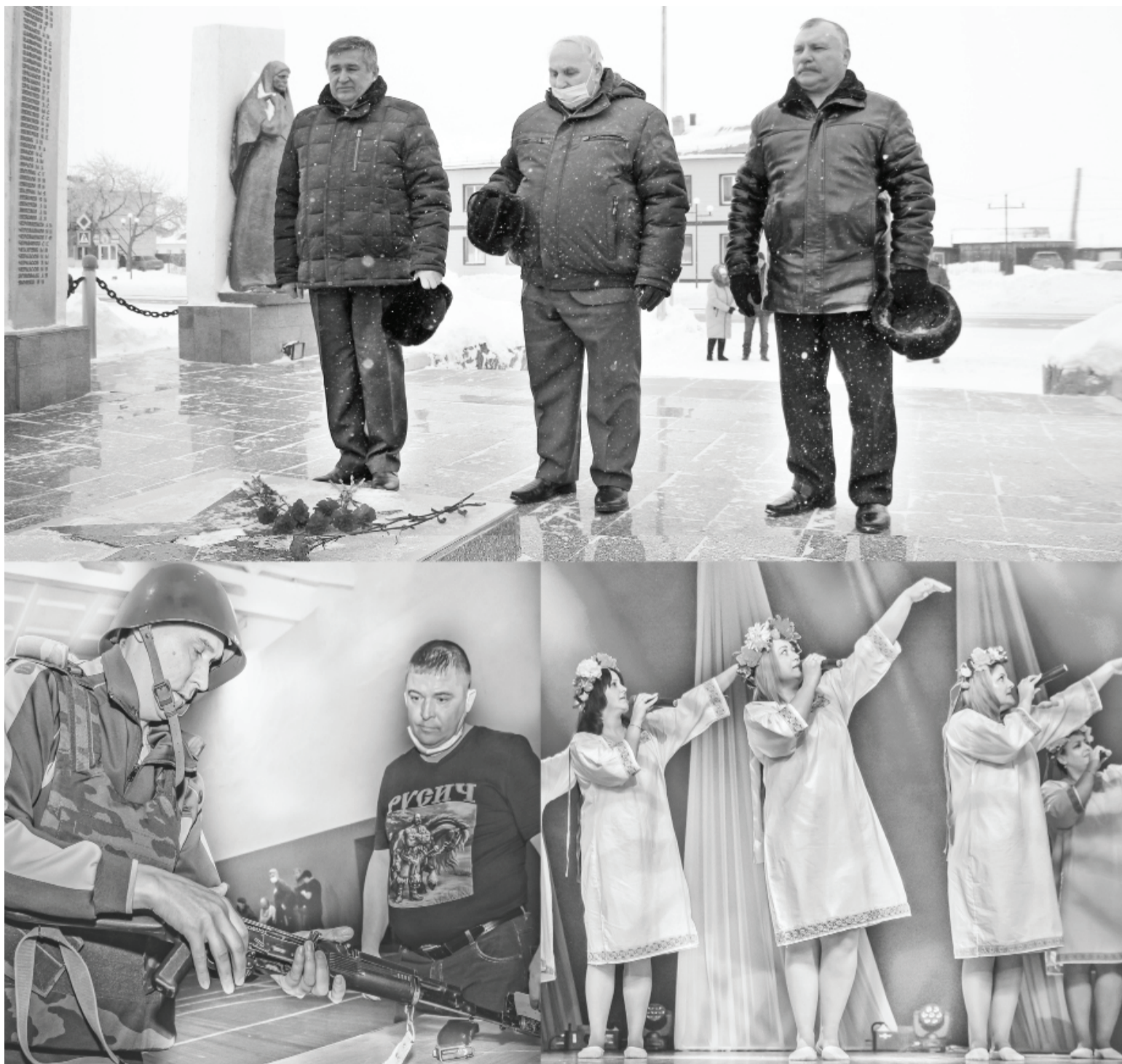
Моменты мероприятий, организованных ко дню мужества и отваги.