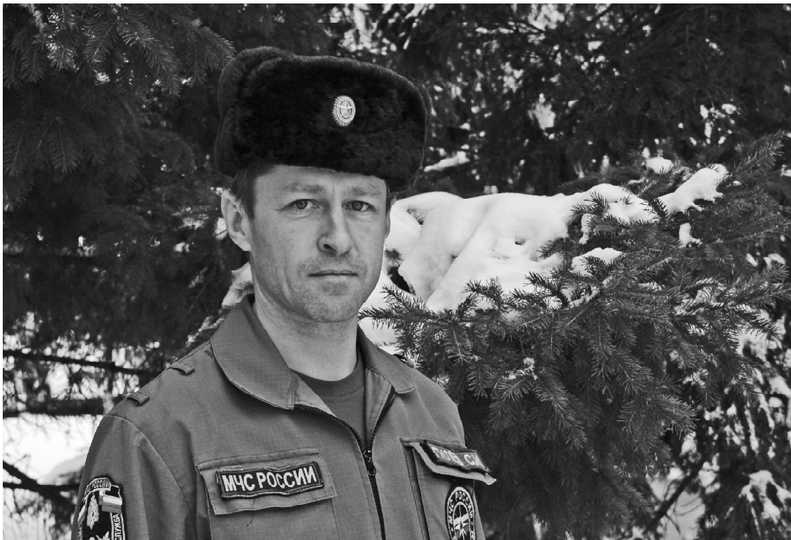
› Сергей Гилёв

27 декабря в нашей стране отмечают День спасателя. Ещё одно название этого праздника – День МЧС. Он появился в 1995 году. Дату назначили в честь принятия постановления о создании спасательной организации.