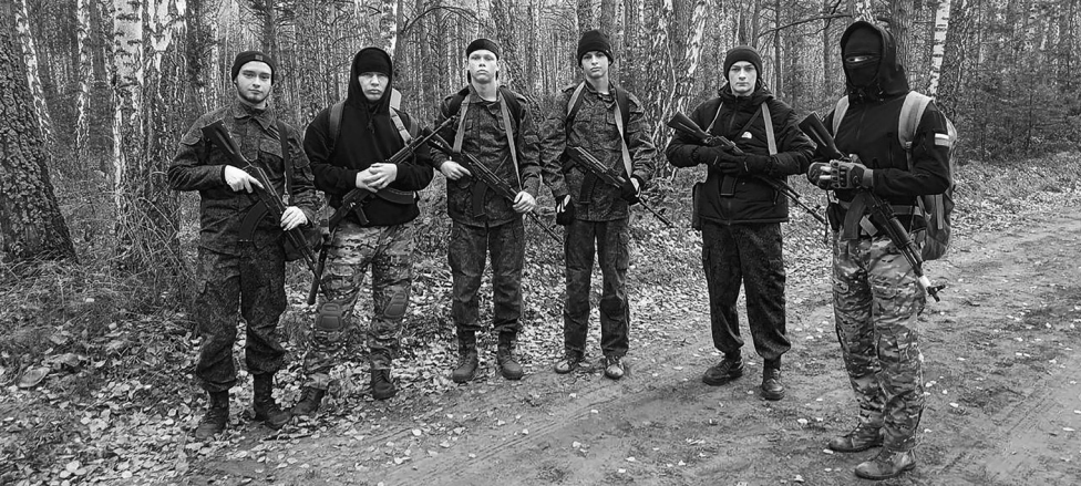
Кадеты школы № 1 приложили немало сил, умений и знаний по основам начальной военной подготовки, чтобы стать призёрами «Суворовского натиска»

Это одно из престижных соревнований среди допризывной молодёжи Тюменской области. Будущие защитники Родины закрепляют здесь свои армейские навыки и знания, полученные в кадетских классах, заодно проходят проверку на смелость, выносливость и командный дух.