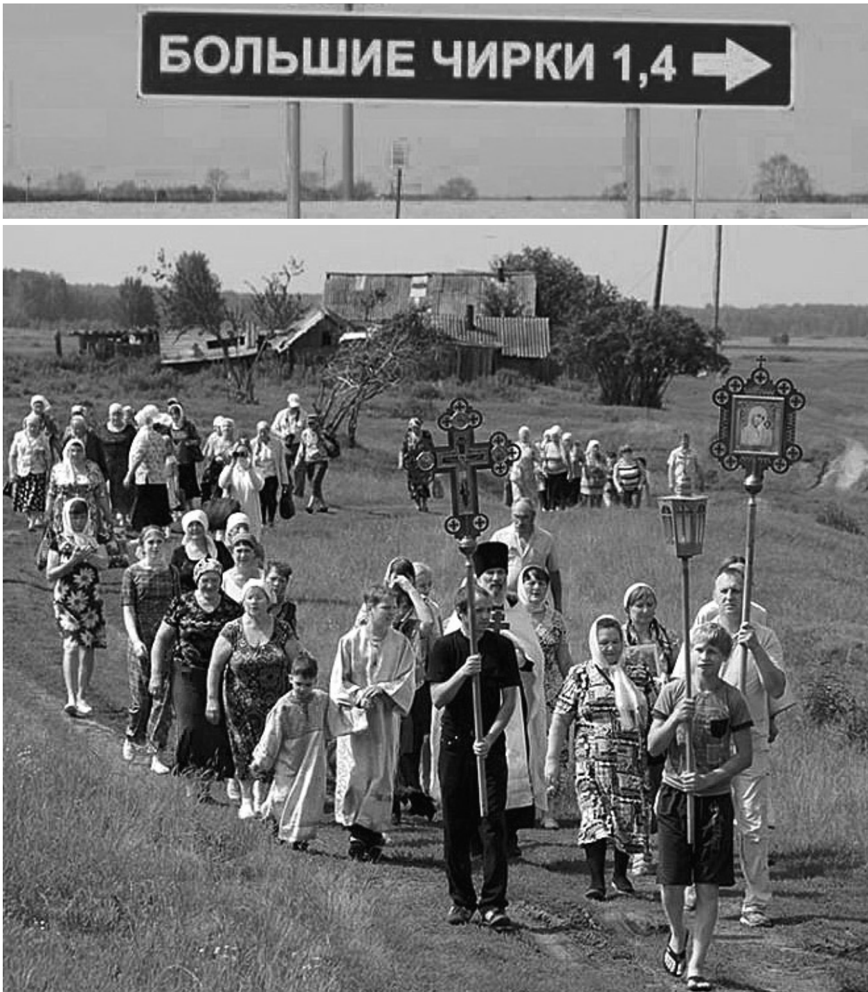
Традиция возрождается. На Ивановский ключ в деревне Большие Чирки совершается крестный ход 7 июля, в День Иоанна Предтечи

Страницы подготовила Любовь АЛЕКСЕЕВА.