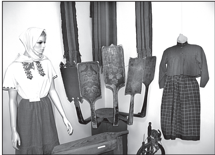
Экспозиции районного музея