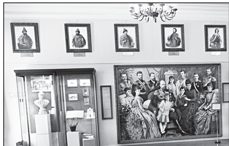
Экспозиции Дома наместника в Тобольске