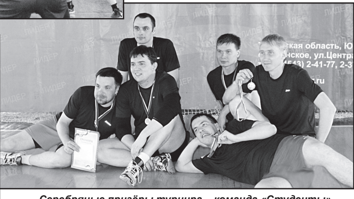
Серебряные призы турнира – команда «Студенты»