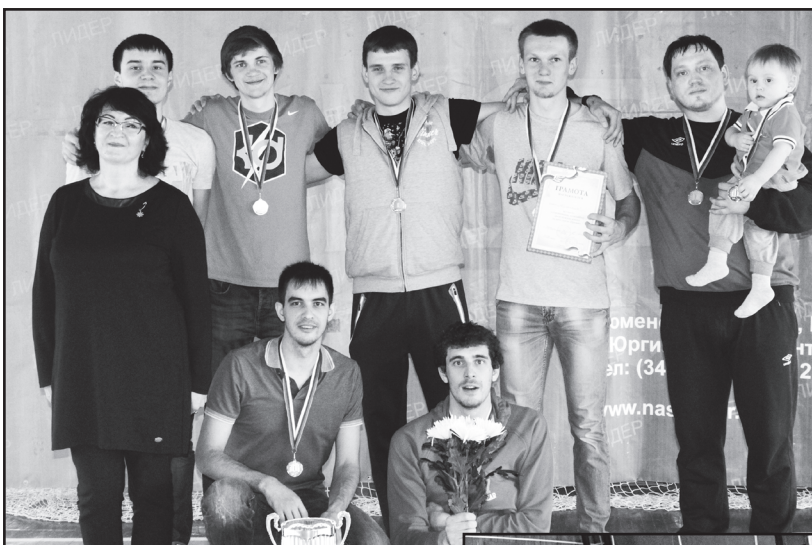
Победители турнира – команда районного центра