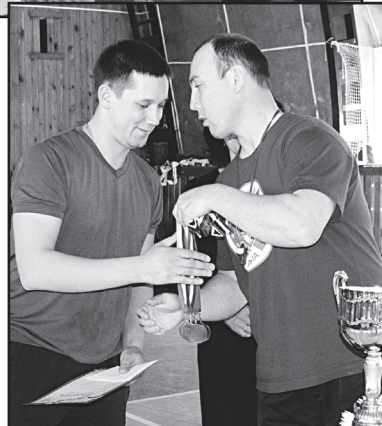
Награды за III место получает капитан команды ОП № 2