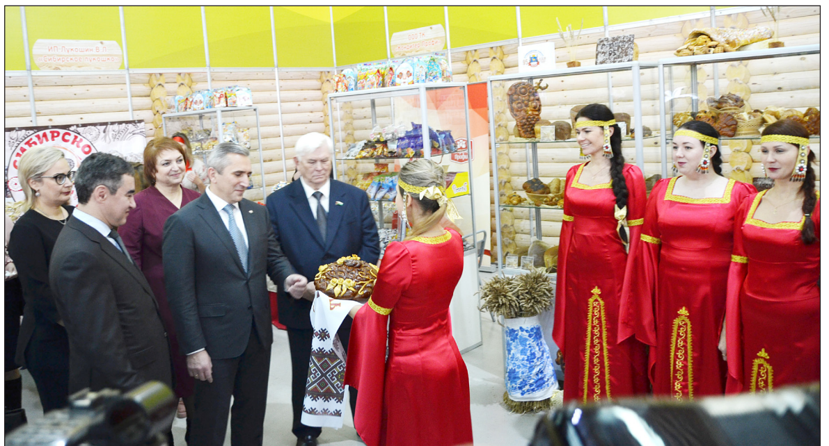
• Аромашевская делегация встретила губернатора Тюменской области Александра Моора хлебом-солью.

В выставочном центре «Тюменская ярмарка» 8 и 9 ноября прошла сельскохозяйственная выставка-презентация «Золотая осень – 2018», которая стала одной из самых масштабных за последние несколько лет. Свою продукцию здесь представили более 70 предприятий юга Тюменской области, в числе которых были как крупные, так и частные и семейные компании.