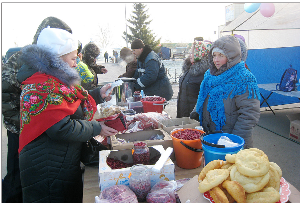
• На осенней ярмарке большим спросом пользовались дикоросы.

Об успехе мероприятия можно судить по тому, насколько привезённая торговцами продукция пользовалась у покупателей спросом, а она была востребована: народ пополнял семейную продовольственную корзину активно. Вполне возможно, что были и те, чьи надежды осенняя ярмарка не оправдала, но большинство посетителей всё же остались довольны: производители смогли реализовать свои излишки, а покупатели приобрести необходимое.