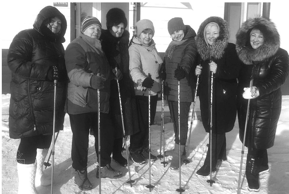
Палочки для скандинавской ходьбы и коврики получила ветеранская организация в рамках реализации проекта

В числе тех, кто получил спортивное оборудование, – ветеранская организация школы №1. Она создана и работает уже давно. Менялись времена, состав, направления работы. Всегда здесь отдавали предпочтение организации наставничества, развивали творческие направления. Всегда жизнь пенсионеров-учителей была насыщенной, интересной и увлекательной. Все созданные ранее традиции сохраняются и теперь, но в этом году добавилось ещё одно направление – спортивное. Появилось помещение, куда приходят участники организации для занятий фитнесом, спортивной ходьбой, лы-