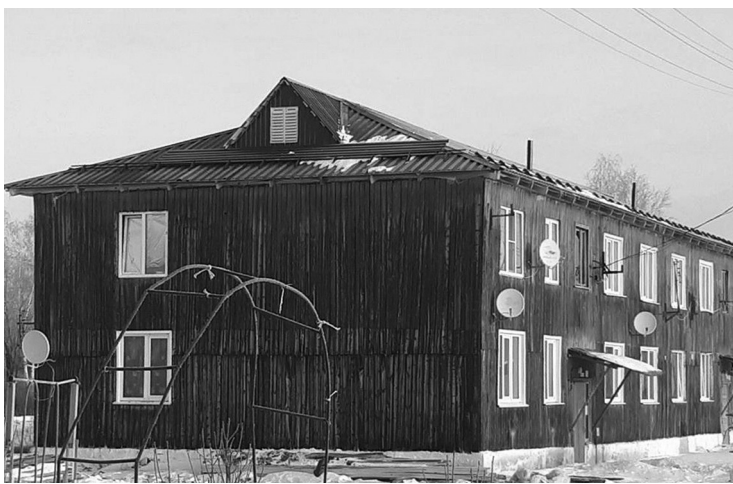
После ремонта дома в п. Нефтянике преобразятся