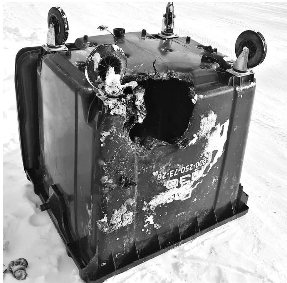
После пожара контейнеры выходят из строя

Например, неделю назад экипаж мусоровоза, прибывший на контейнерную площадку тюменского предприятия, потушил возгорание мусора в баках. А на днях небрежность жителя Ишимского района чуть не привела к более серьёзным последствиям, чем испорченные ёмкости: выброшенная кем-то тлеющая зола осталась незамеченной и попала из контейнеров в мусоровоз. О возгорании содержимого кузова стало известно уже в пути. Только благодаря собранности и оперативным грамотным действиям работников не только сами не пострадали, но и спасли спецтехнику. "Огонь одинаково опасен для любых видов контейнеров: металлические ёмкости быстро ржавеют и рассыпаются, а пластиковые перестают быть герметичными, деформируются или плавятся. Из-за таких инцидентов привычное место сбора коммунальных отходов может