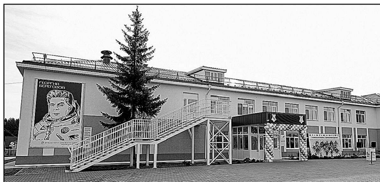
Школа в Княжево после капитального ремонта.

Богандинский долгий год был одним из центров промышленного производства в Тюменском районе, и примечательно, что 13 из 17 инвестиционных проектов – это объекты промышленности.