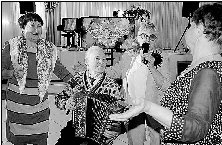
Ветераны Богандинки – инициаторы добрых дел.