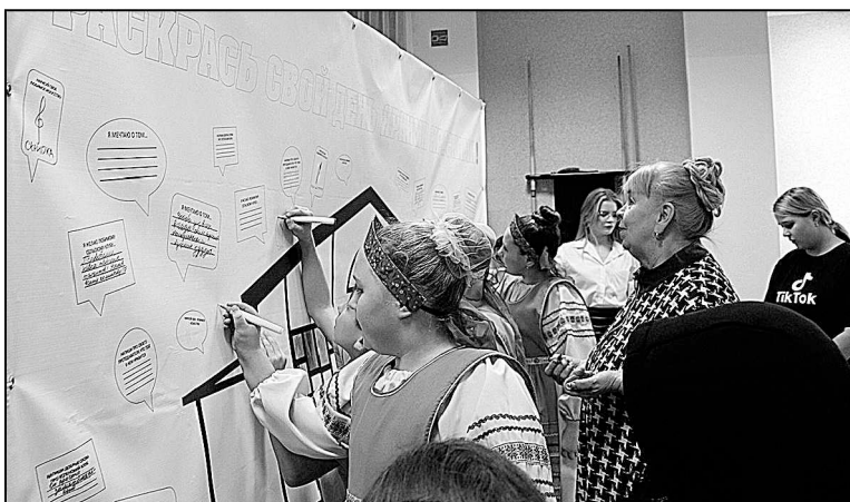
Пожелания работникам культуры.