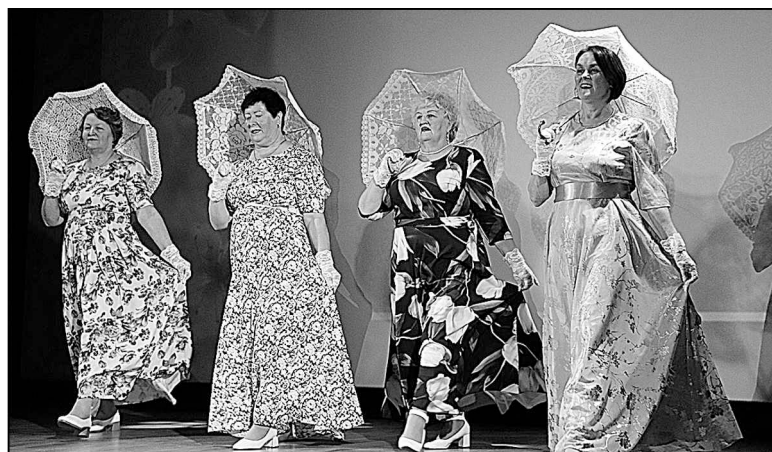
На сцене – представители элегантного возраста.

ты вкладывали душу, артистизм, азарт. Зрители по достоинству оценили выступления и наградили артистов бурными аплодисментами.