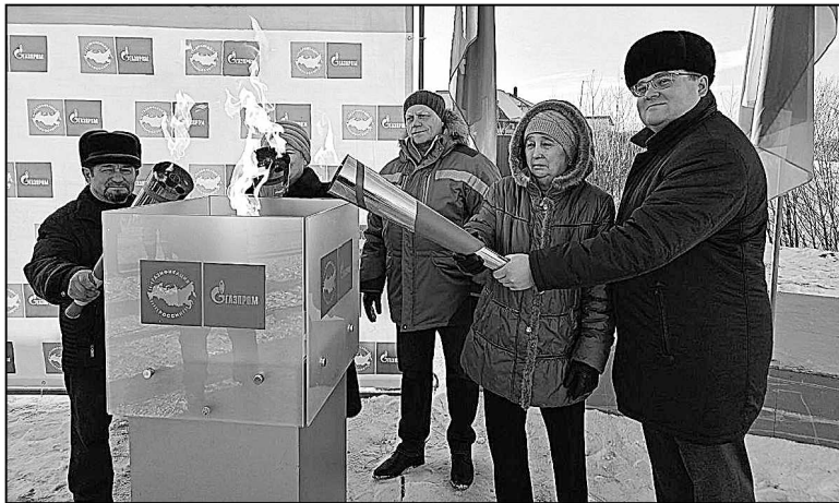
В 2024-м в Кыштырлу пришел газ.

Продолжалась работа по обеспечению пожарной безопасности территории. Обновлены и расширены минерализованные полосы по всему периметру поселения,