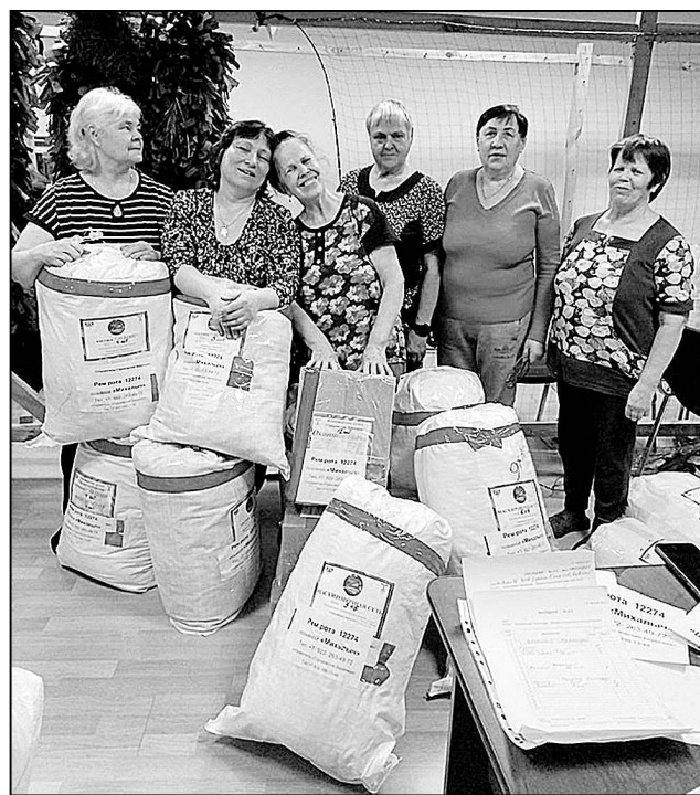
«Горьковские берегини»: груз к отправке готов.

Мария КОРАБЛЕВА.