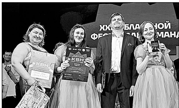
Команда КВН «Сделано в Сибири».