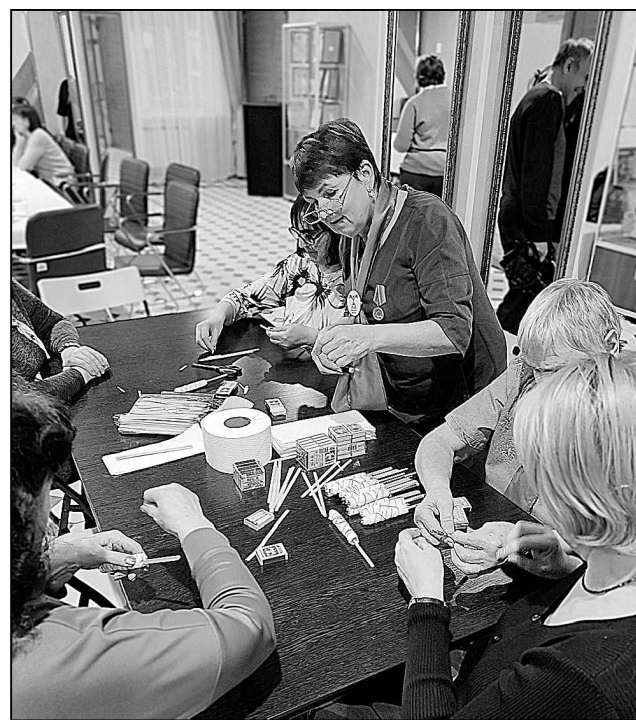
Мастер-класс по изготовлению охотничьих спичек.