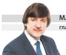
МАКСИМ АФАНАСЬЕВ глава города Тобольска

Пусть свет и радость Рождества Христова придут в каждую семью. От всей души желаю крепкого здоровья, благополучия и взаимопонимания.