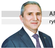
АЛЕКСАНДР МООР губернатор Тюменской области

№150 (29398), четверг, 28 декабря 2023 г.