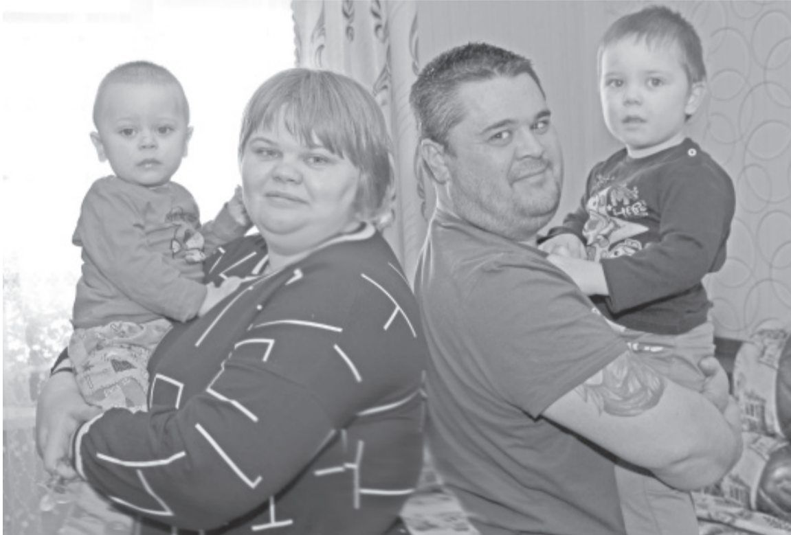
Искренность, забота друг о друге и доверие – главное для усовской семьи.

В селе Усово живёт разнонациональная семья