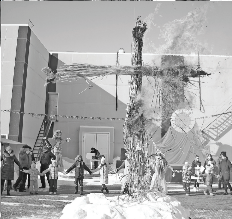
Игры, состязания, хороводы, сжигание чучела – моменты масленичного торжества.