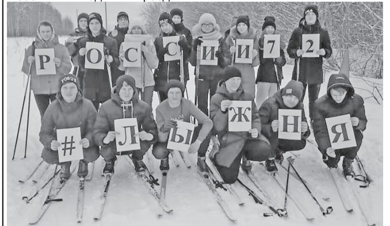
Сладковские восьмиклассники – самые спортивные ребята.

Людмила ВЕРХОШАПОВА