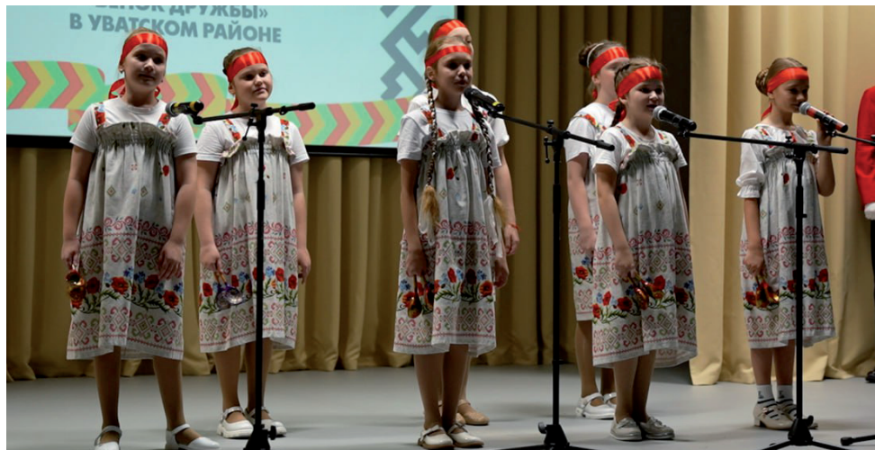
Выступление воспитанников филиала ДШИ.