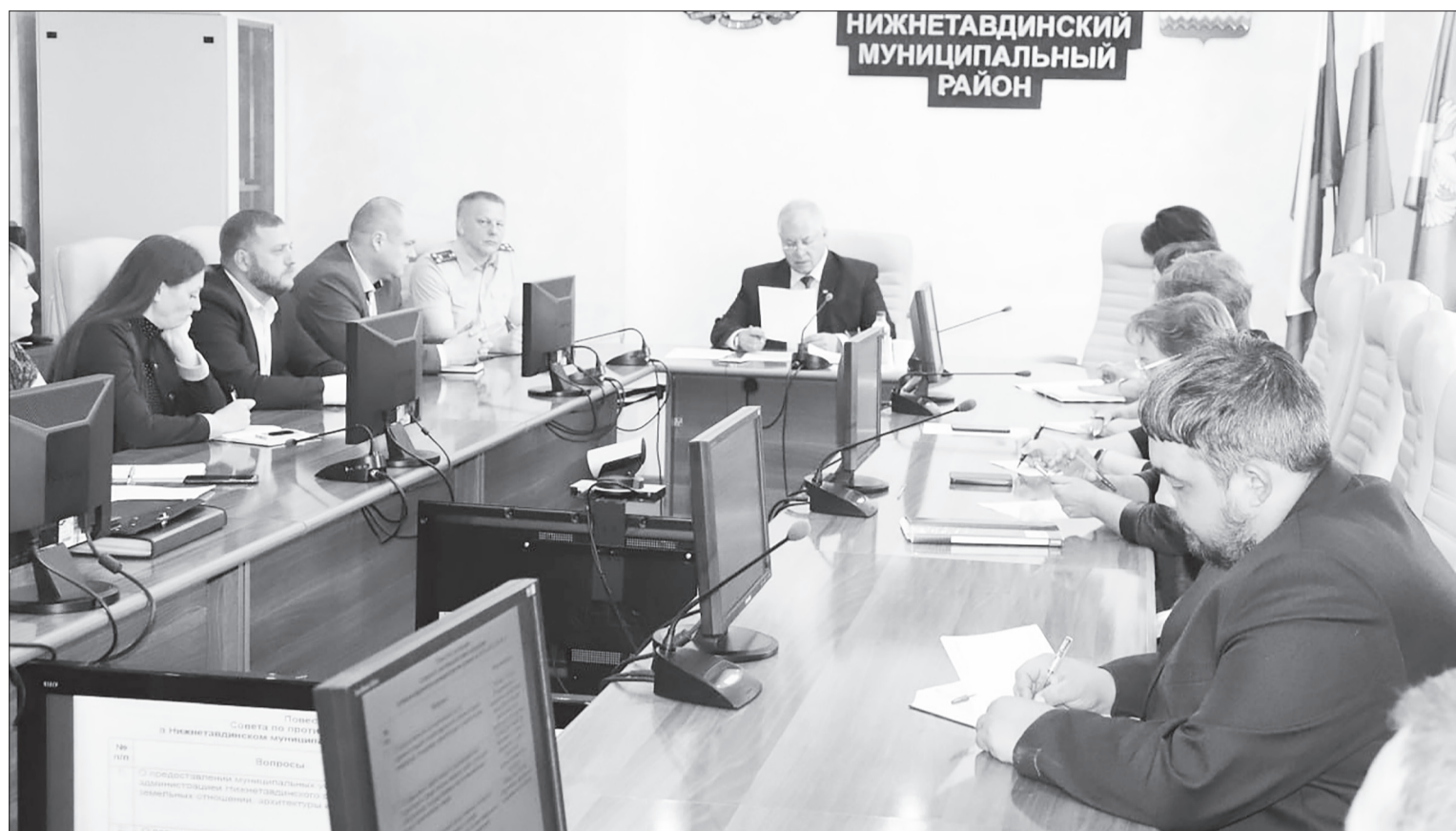
■ На совете по противодействию коррупции обсудили самые актуальные вопросы полугодия.