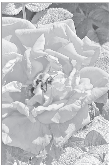
Этих полезных насекомых надо беречь.

Как сообщили специалисты Тюменского межрайонного отдела филиала Россельхозцентра по Тюменской области, наблюдается массовая гибель пчелиных семей при обработках посевов рапса.