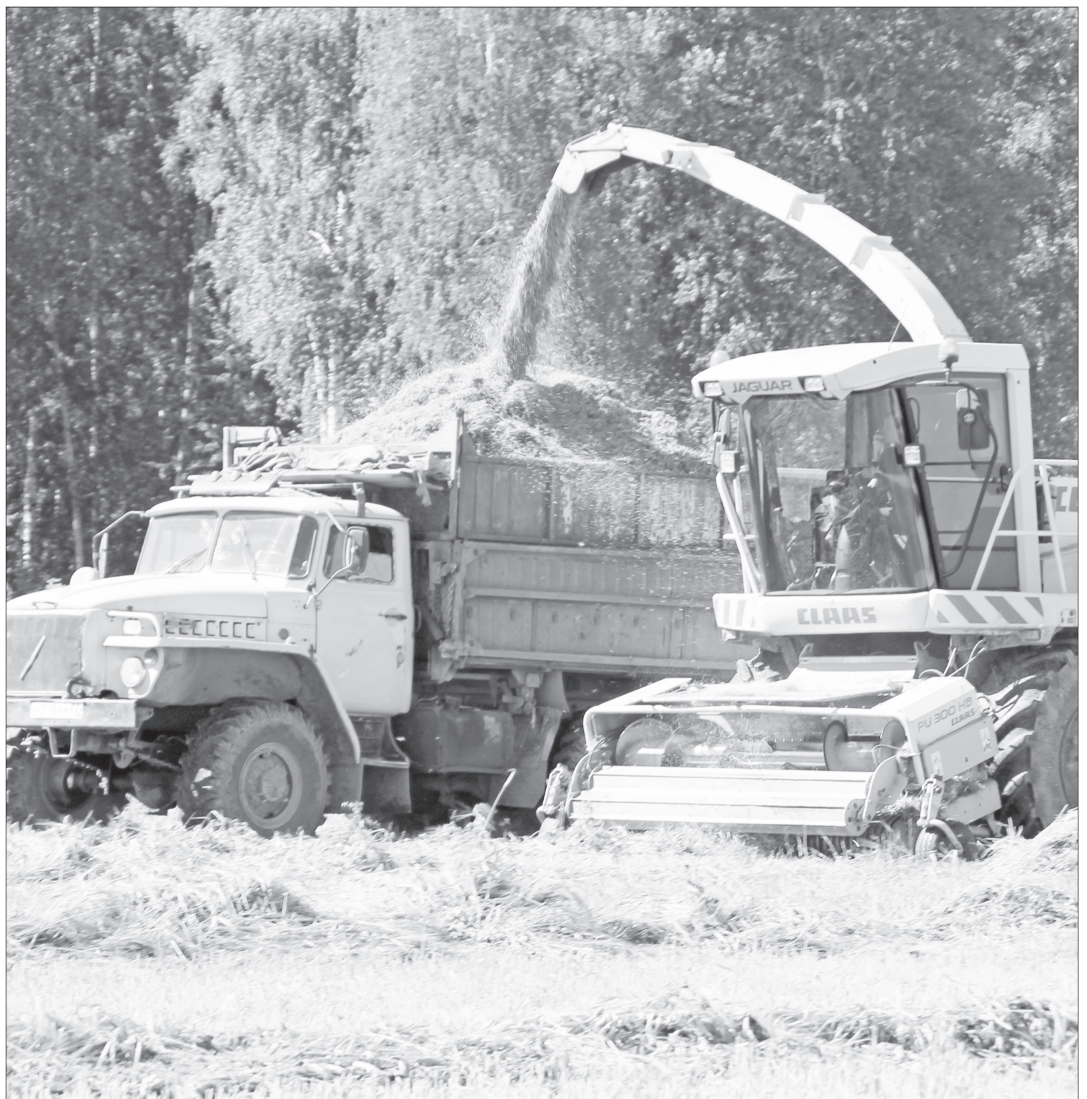
Агрохолдинг «Нижнетавдинский» уже приступил к уборке сырья на сенаж.

В животноводческих хозяйствах идёт подготовка техники к заготовке кормов. Предстоит заготовить 24 415 т сенажа, 25 000 т силоса и 4 250 т сена. Вся кормозаготовительная техника в исправном состоянии. Агрохолдинг «Нижнетавдинский» уже получил 500 т готового сенажа.