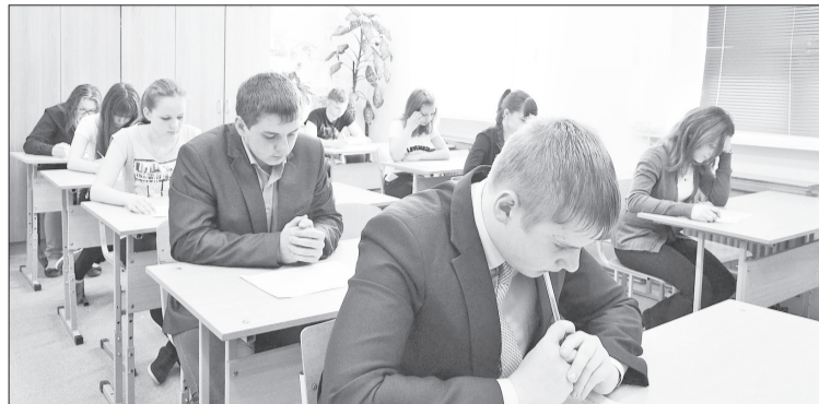
Идёт экзамен.

309 выпускников сдавали основные предметы. Более высокий балл, чем в прошлом году, по русскому языку, литературе, географии и истории.