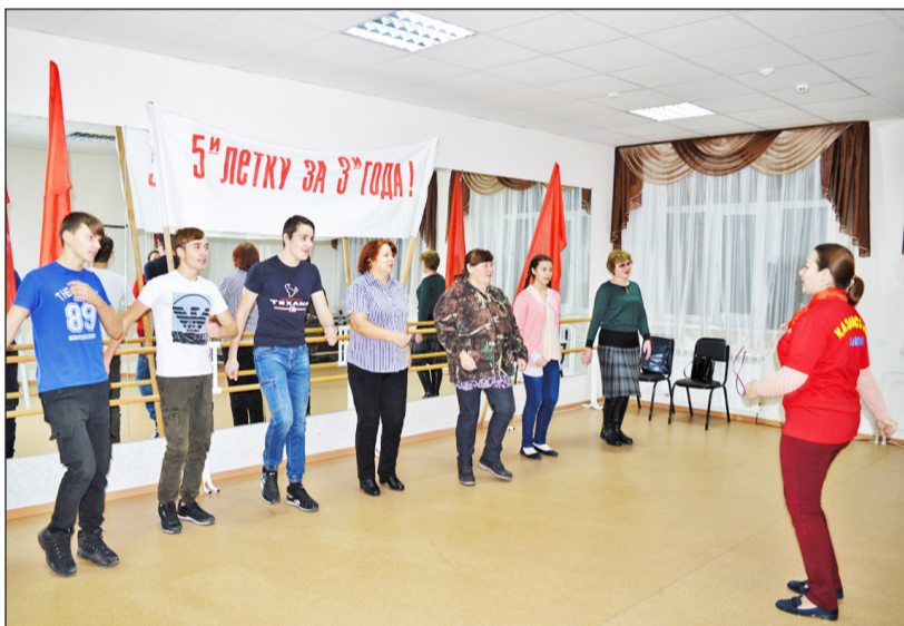
Гости мероприятия с интересом окунулись в эпоху социализма