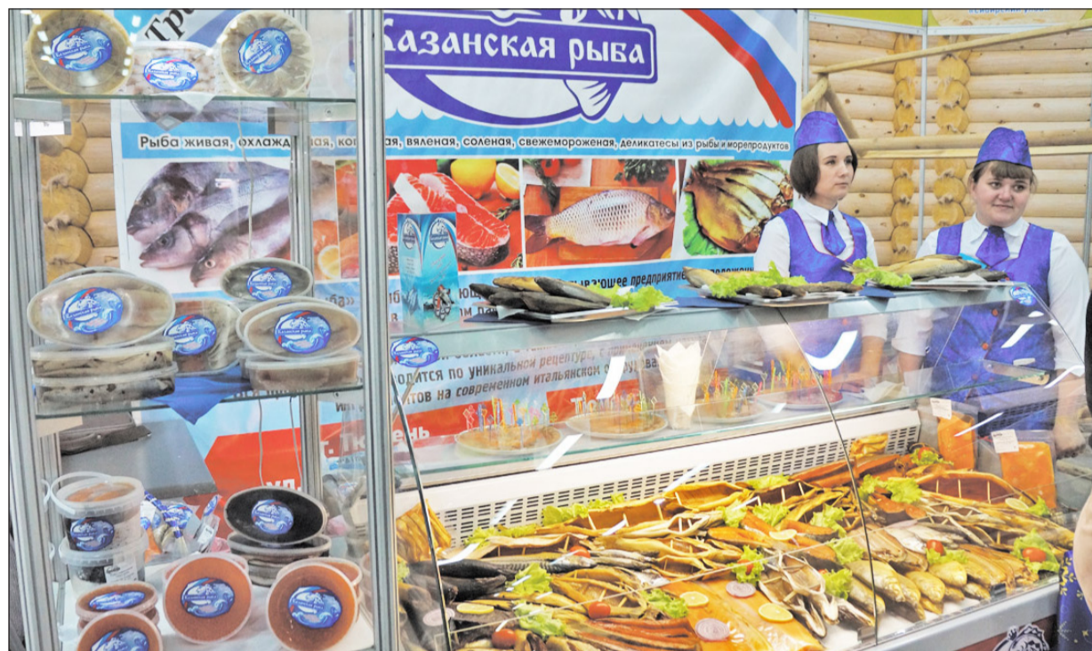
Продукция ЗАО «Казанская рыба» весомо дополняет линейку рыбных продуктов на любой широкомасштабной ярмарке в районе и регионе

Под таким названием 8 и 9 ноября в Тюмени прошла традиционная региональная выставка-презентация продукции предприятий АПК в рамках проведения профессионального праздника работников отрасли. Всё это в совокупности стало итоговым событием уходящего сельскохозяйственного года.