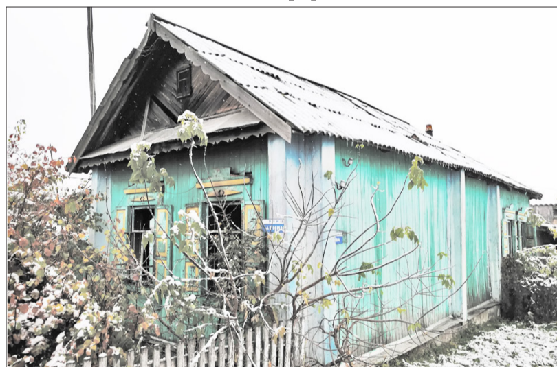
Дом, пострадавший от пожара

За прошедший период текущего года в сравнении с прошлогодними показателями отмечен значительный рост случаев гибели людей на пожарах. 15 октября произошёл пожар в жилом доме, расположенном в с. Афонькино. В результате происшествия погиб ребёнок 2017 года рождения. По данному факту проводится проверка, в ходе которой будут установлены обстоятельства и причина пожара. Возможно, жертв было бы больше, но жилой дом был оборудован автономным дымовым пожарным извещателем, который сработал при обнаружении задымления и звуковым сигналом оповестил о возгорании, что позволило жильцам эвакуироваться.