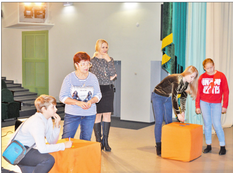
Ответ на каверзный вопрос нужно было дать быстрее своих соперников