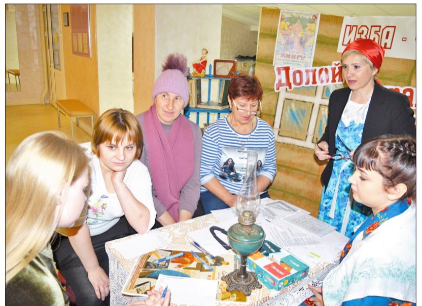
Игры с буквами и словами оказались очень занимательными

давности очень далека, да и о дворовых играх имеет смутное представление. Неунывающие ведущие решили восполнить этот пробел: речёвку с гостями разучили (не объяснив, правда, где и для чего её применяли) и поиграли с ними в одну из дворовых игр.