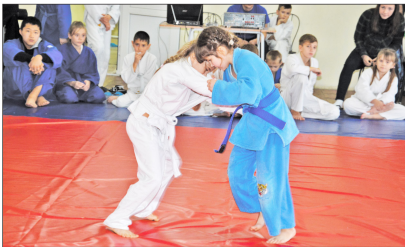
В «Медведе» учат побеждать и знают, как это делать

В результате за годы упорной работы несколько воспитанников «Медведя» вошли в сборную Тюменской области по дзюдо, два спортсмена стали кандидатами в мастера спорта по армейскому рукопашному бою. Два