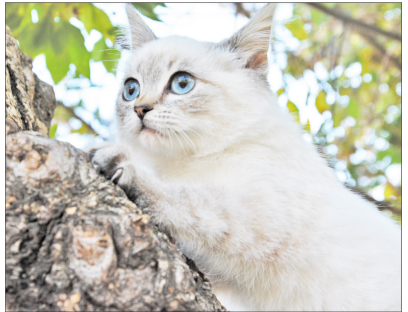
В предвкушении зимы

Первого ноября в Казанской школе прошёл ежегодный конкурс среди учащихся 7-х и 8-х классов под названием «Осенний дебют». По его условиям участникам требовалось создать небольшой видеоролик о жизни класса, в котором нужно было отразить, что мы все разные, но между нами много общего, нас объединяют общие цели и дела. На выполнение задания участникам давался один месяц. В состав жюри вошли компетентные люди, которые сами не