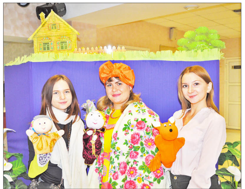
В роли актёров кукольного театра побывали все желающие

Получив мощный заряд бодрости, команда отправлялась на следующую площадку под названием «Назад в СССР». Здесь предлагали вспомнить пионерские песни, речёвки и дворовые игры. Вот тут-то и выяснилось, что современная молодёжь от песен и речёвок 40-летней