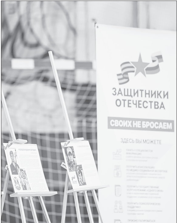
Турнир, посвящённый памяти участников СВО, прошёл в спортзале молодёжного центра