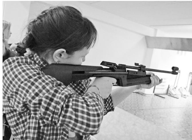
Прицел – и в «яблочко».

Победитель в силовом двоеборье, например,