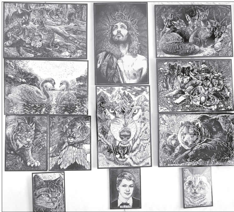
Работы супруга Сергея украшают стены дома Зубаревых

Елена Геннадьевна говорит, что поначалу пришлось заглянуть в интернет и пройти простейшие курсы по изготовлению различной сувенирной продукции. Первые работы появились осенью 2014-го, это были символы наступающего года Обезьяны по восточному календарю. Теперь же счёт изготовленных ею игрушек, кукол уже идёт на сот-