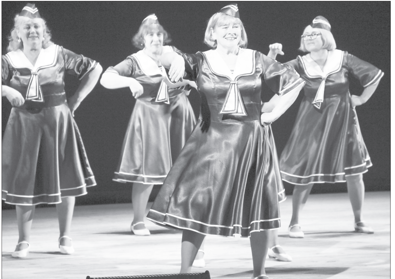
Коллектив «Любава» из проекта «Возраст танцам не помеха» стал обладателем диплома лауреата первой степени за энергичный морской танец

Наши. Интересной показалась постановка колыбельной в исполнении ансамбля «Гаврош» из «Арт-Вояжа». Во-первых, чистейшая этника, во-вторых, это, наверное, было сложно - копнули глубоко. Номер смотрелся как сцена из спектакля. Сразу три группы проекта «Возраст танцам не помеха» представили из АНО ДПО «Точка», все получили дипломы лауреатов первой, второй и третьей степеней, но лично мне наиболее интересным показался сюжетный ход «Гармонии», когда женщины одна за другой скидывали почти монашеские тёмные накидки и представляли в белоснежном облике с крыльями под известную песню «Журавли»