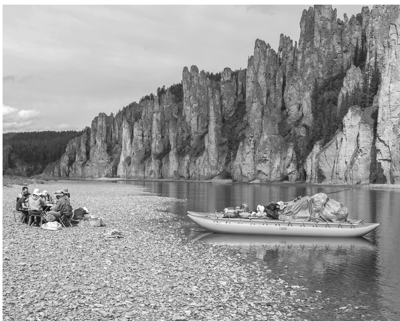
В Бурятию стоит приехать и для того, чтобы полюбоваться красотами природы

В Республике реализуется проект «100 уникальных сел Бурятии». Разработано 15 уникальных туристических маршрутов. Это посещение крестьянско-фермерских хозяйств, конферм, страусовых и мараловых ферм, минеральных источников,