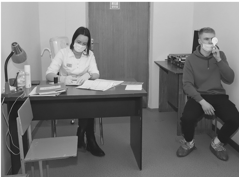
Хорошее зрение в армии важно