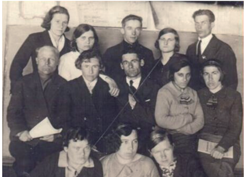
Коллектив Демьянской школы (конец 1930 года).