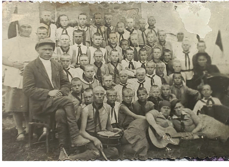
Пионерский лагерь в селе Юровском (июнь 1935 года).