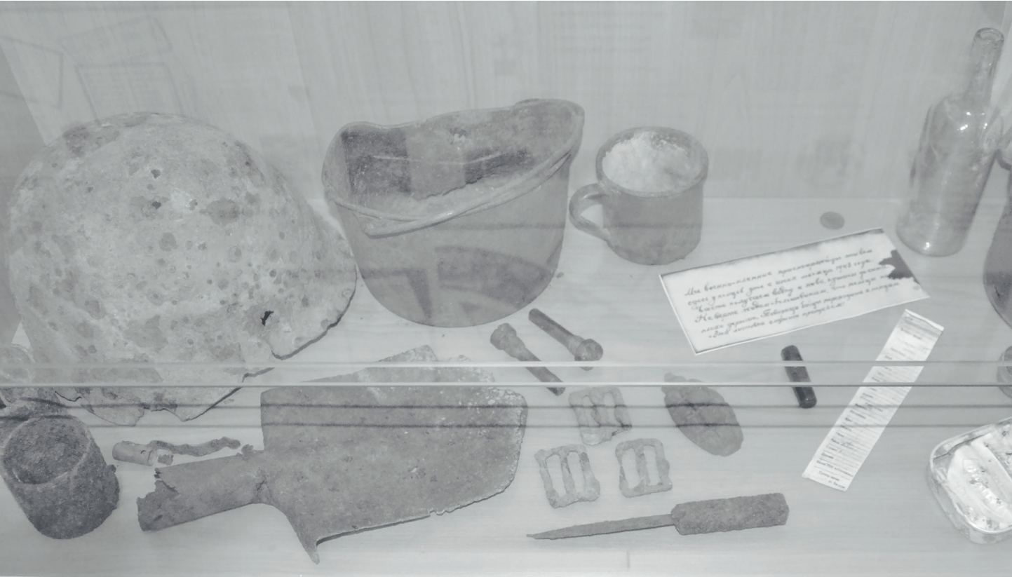
Артефакты времён Великой Отечественной войны – историческая ценность.