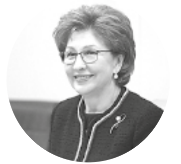
ГАЛИНА КАРЕЛОВА, председатель Совета Евразийского женского форума, сенатор:

«мужскими». Центральным событием стала встреча с Сообществом равных возможностей СИБУРа, в ходе которой участники обсудили, как работает женщинам в нефтехимии, а также инструменты и шаги по популяризации нефтехимических и производственных профессий для женщин и развитие международной кооперации в рамках «Женских двадцатки» (W20).