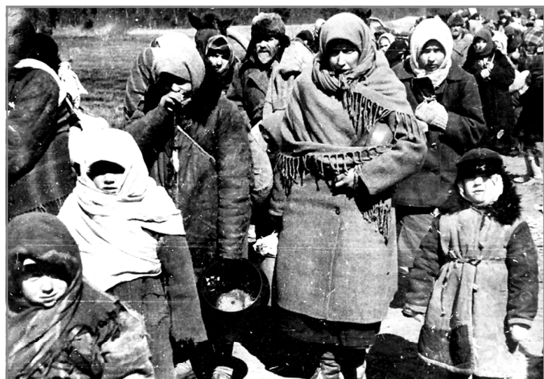
Население готовится к приходу карателей