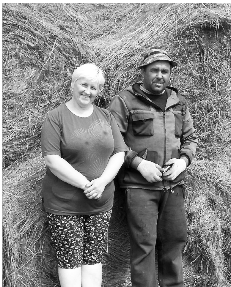
Трудолюбивые хозяева большого подворья