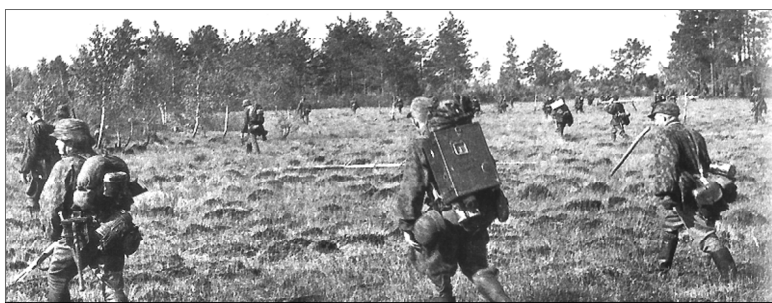
Подразделение СС прочесывает местность

Наибольшей жестокостью отличился батальон СС Оскара Дирлевангера, который действовал на территории Беларуси с