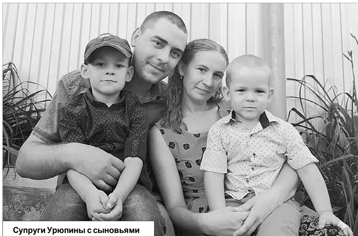
Супруги Урюпины с сыновьями

Будьте бдительны и соблюдайте законодательство РФ!