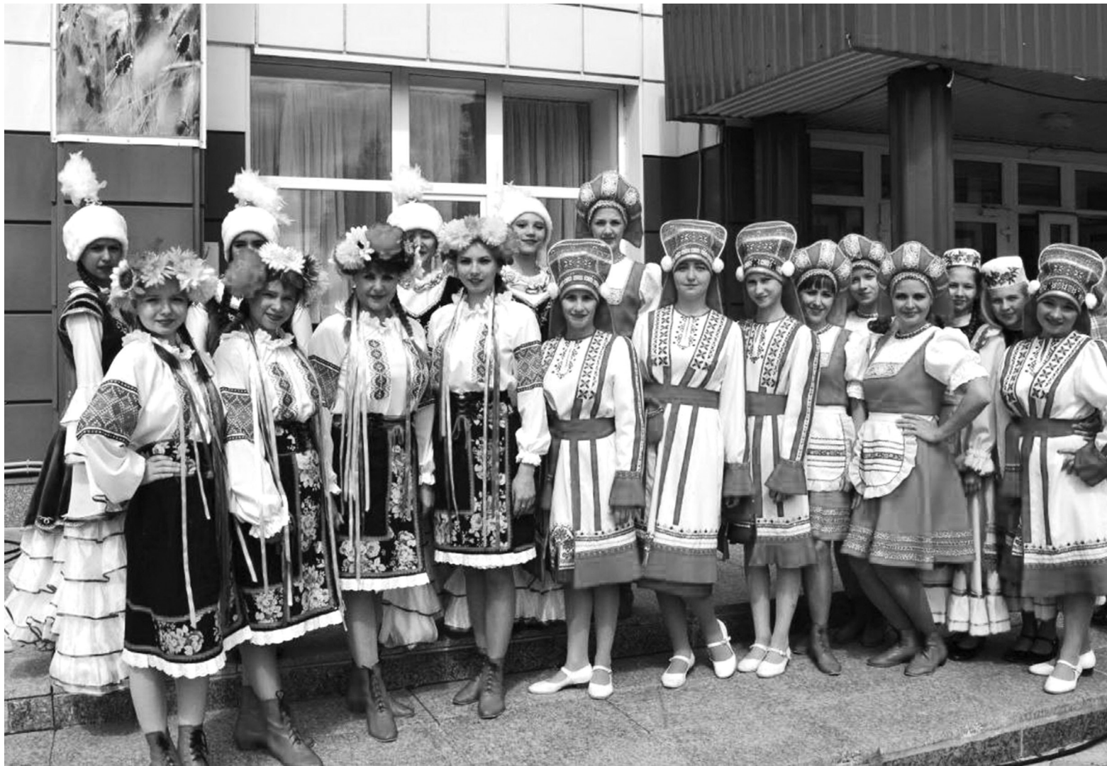
📷 Единство нашей страны в её многообразии / ФОТО: АРХИВ

В центре внимания. Президент Владимир Путин официально дал старт Году единства народов России