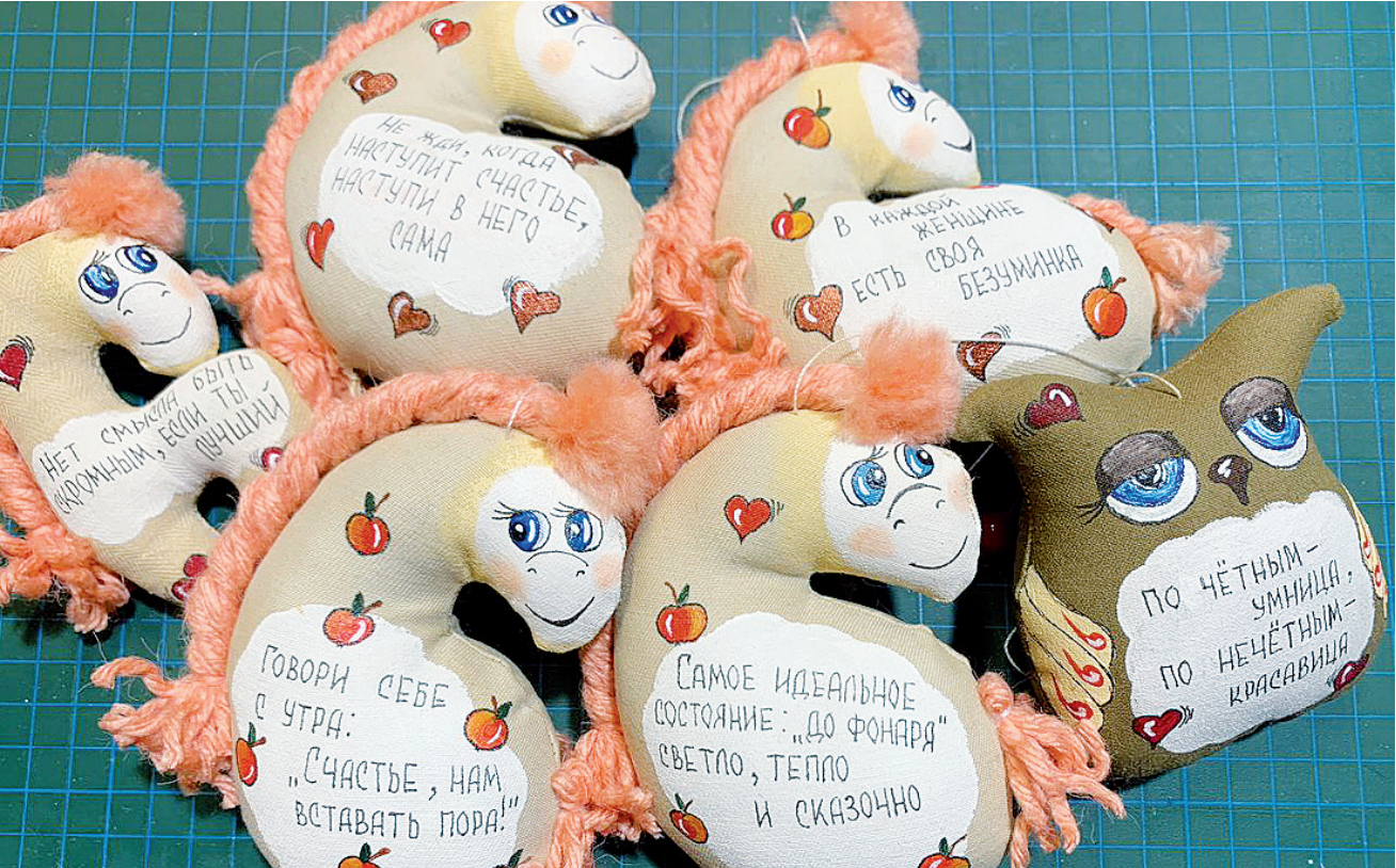
► Работы Анны Мирхазановой