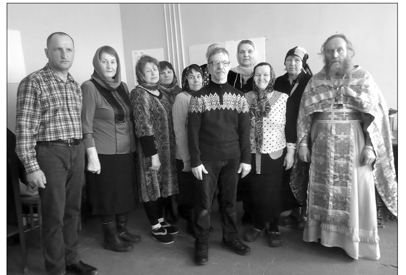
Первая литургия состоялась в Великий пост

Спешите делать добро! Община храма в честь Георгия Победоносца д. Дранкова.