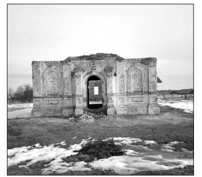
Храм в честь Георгия Победоносца в Дранкова

рам, благотворителям и всем добрым людям, кто хочет и может помочь спасти и восстановить храм в деревне Дранкова, за финансовой и материальной помощью! Средства можно направить на реквизиты Голышмановского храма: