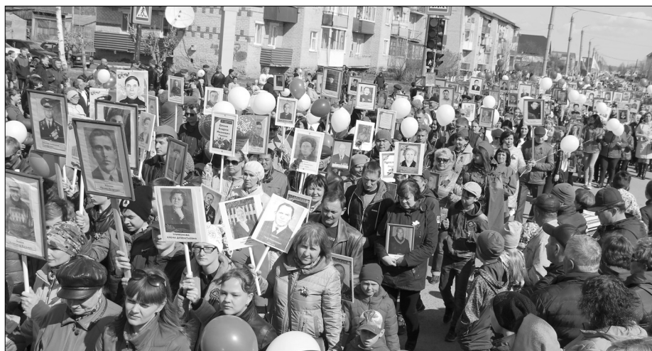
Ряды «Бессмертного полка» ширятся: в прошлом году с портретами воинов-победителей прошли уже более двух тысяч жителей нашего округа

В преддверии Дня Победы ученики участвуют в патриотических акциях, смотре почётных караулов, военизированной эстафете, спортивных соревнований и флешмобах, посещают выставки, уроки мужества, несут вахты Памяти.