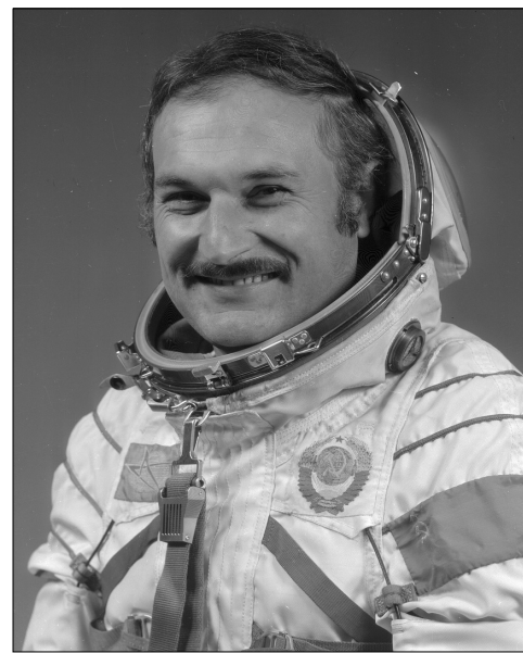
Космонавт Виталий Жолобов