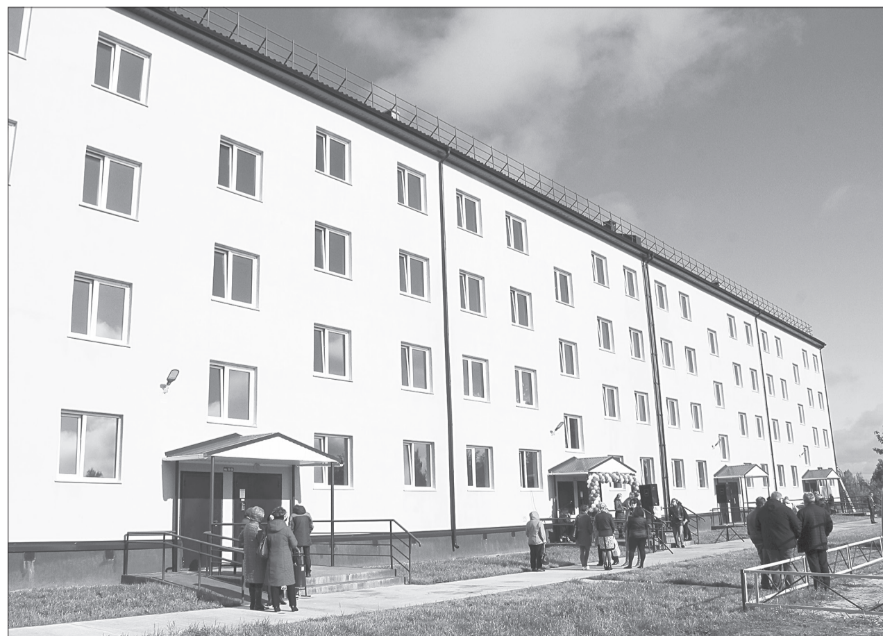
Дом по адресу ул. Революции, 185 стал самым большим из возведённых в Ялуторовске за последние годы