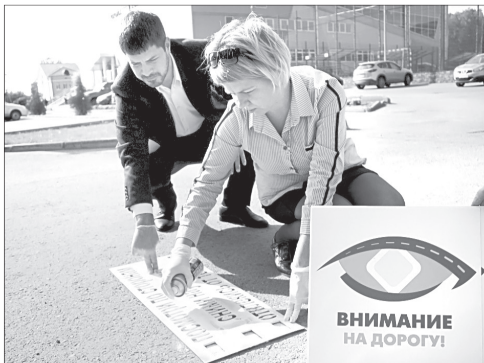
Заранее подготовленные трафареты позволяют быстро наносить предупреждающие надписи на тротуары

Надписи уже нанесены на нескольких переходах, в местах, где в авариях пострадали юные пешеходы и велосипедисты. В дальнейшем памятки на асфальте планируется разместить во всех точках города с плохой видимостью для водителей и там, где ранее были совершены наезды на пешеходов.