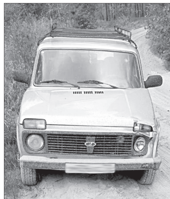
«Ниву», оставленную на лесной дороге близ села Новоатъялово, возможно протаранил УАЗ