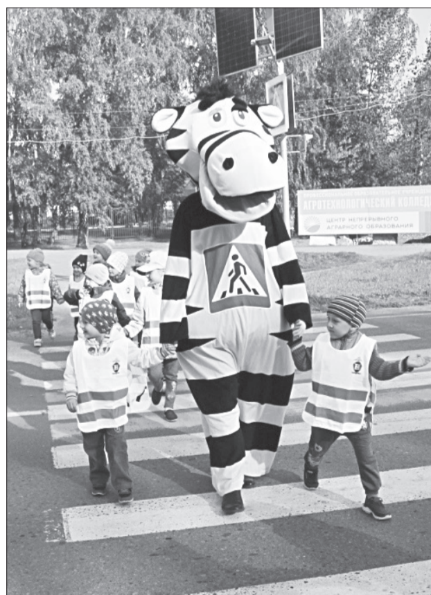
С начала учебного года сотрудники ГИБДД и образовательных учреждений города и района повторяют с детьми ПДД

Госавтоинспекция города Ялуторовска обращается ко всем водителям: будьте предельно внимательны к юным участникам дорожного движения, особенно вблизи школ, а также не забывайте о себе. Если чувствуете усталость – отдохните, прежде чем сесть за руль.