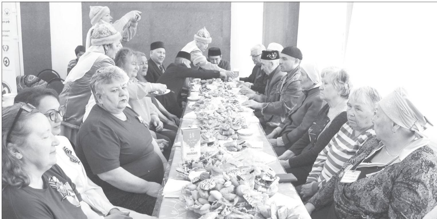
К чаепитию приступили только после чтения Корана и раздачи садаки, то есть добровольной милостыни

В ЦНК провели древний мусульманский ритуал