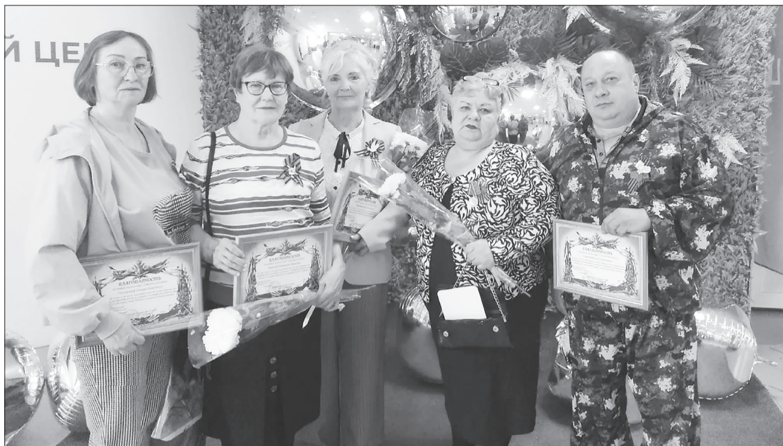
Ялуторовчане помогают бойцам с самого начала СВО