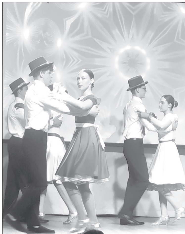
Зрители смогли увидеть танцевальные номера самых разных направлений

На «Вернисаже танцевальных историй» побывали и ветераны-пограничники. От своей общественной организации они вручили активным участникам концерта награды за значительный вклад в сохранение культурных традиций, формирование крепкого духовного фундамента подрастающего поколения.