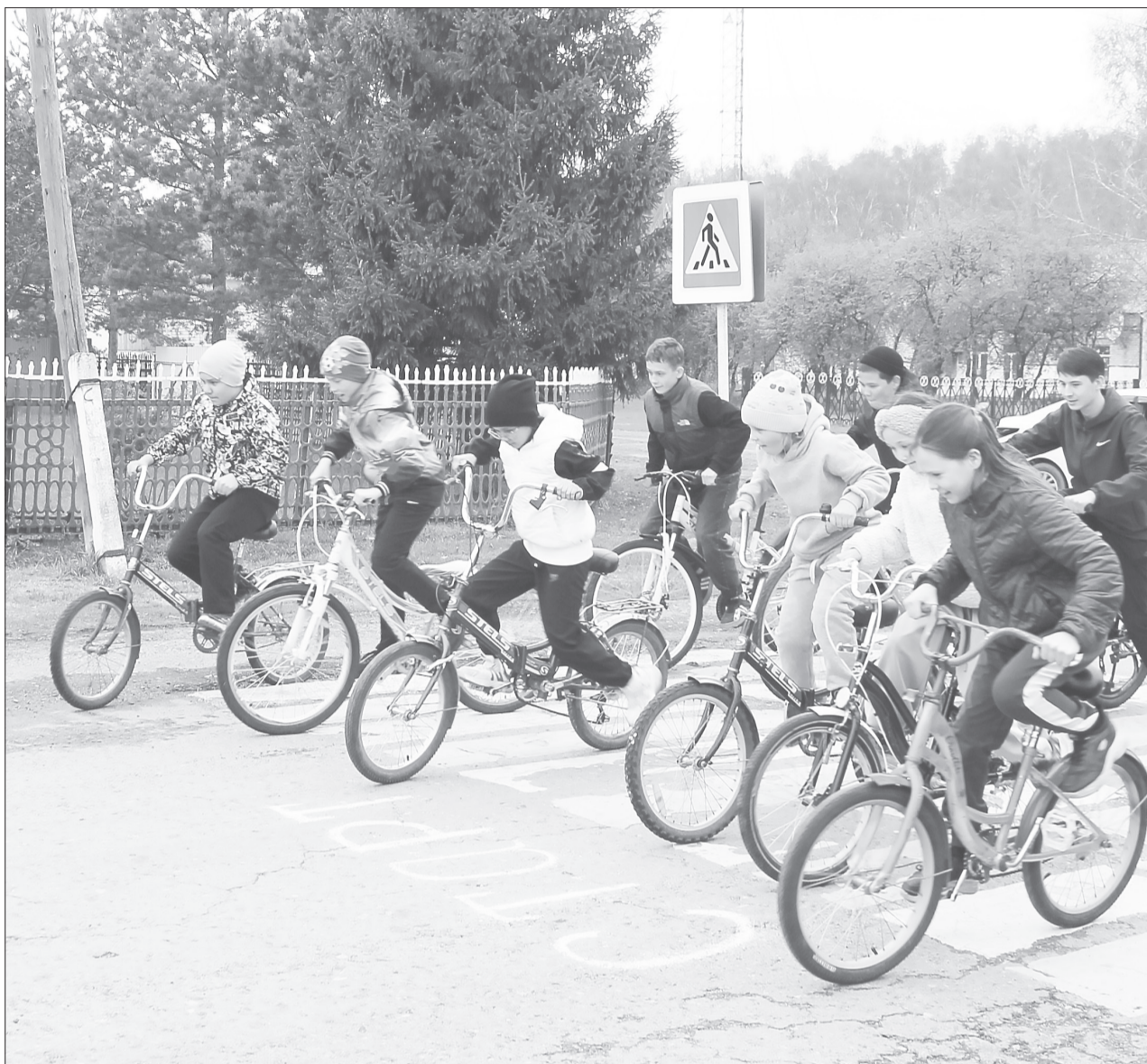
Участники всех возрастных категорий стартовали одновременно