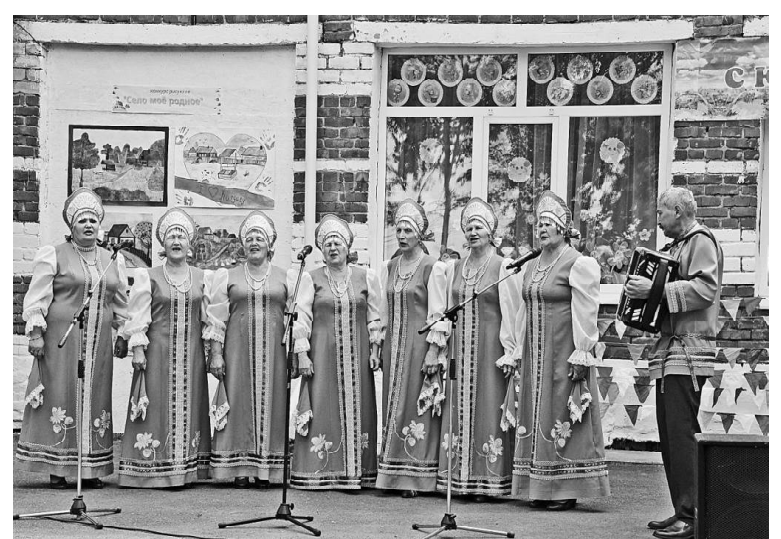
Моменты праздника