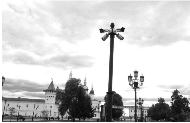
» Вот такие камеры на улицах Тобольска

систему видеонаблюдения, мы можем оценивать ситуации даже в тёмное время суток. Видеонаблюдение ведётся в онлайн-режиме. Изображение с камер передаётся в центр обработки данных правительства Тюменской области по защищённому высокоскоростному каналу связи. Камеры видеонаблюдения подключены к региональной системе «Безопасный город». Сотрудники полиции и ЕДДС следят за обстановкой на аллеях большого и малого туристических маршрутов города, на Красной площади Кремля, в парках, скверах и на других объектах с массовым скоплением людей.