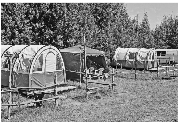
» Туристический комплекс «Бастион»