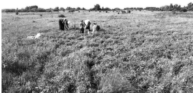
» Фото Савелия ЗАЙКИНА

Лето, середина июля, жаркие деньки, самое время похода по ягоде. Среди многообразия ягод именно сейчас у жителей Викуловского района особым вниманием пользуется клубника луговая (полуница или земляника зелёная). Но почему именно эта ягода привлекает людей? Для того чтобы разобраться, я провёл социологический опрос. Стоит начать с происхождения названия этой ягоды. Название «клубника» происходит от славянского и старорусского слова «клуб», означающего «шаровидный, круглое тело». Земляника зелёная названа так потому, что у неё даже полностью не вызревшие ягоды, имеющие зеленовато-белый цвет, обладают мягким специфическим вкусом. А «полуницей» её называют из-за того, что практически вызревшие ягоды полукрасные.