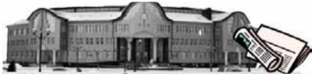
Администрация Уватского муниципального района

20 апреля в здании администрации Уватского муниципального района состоялось очередное аппаратное совещание.