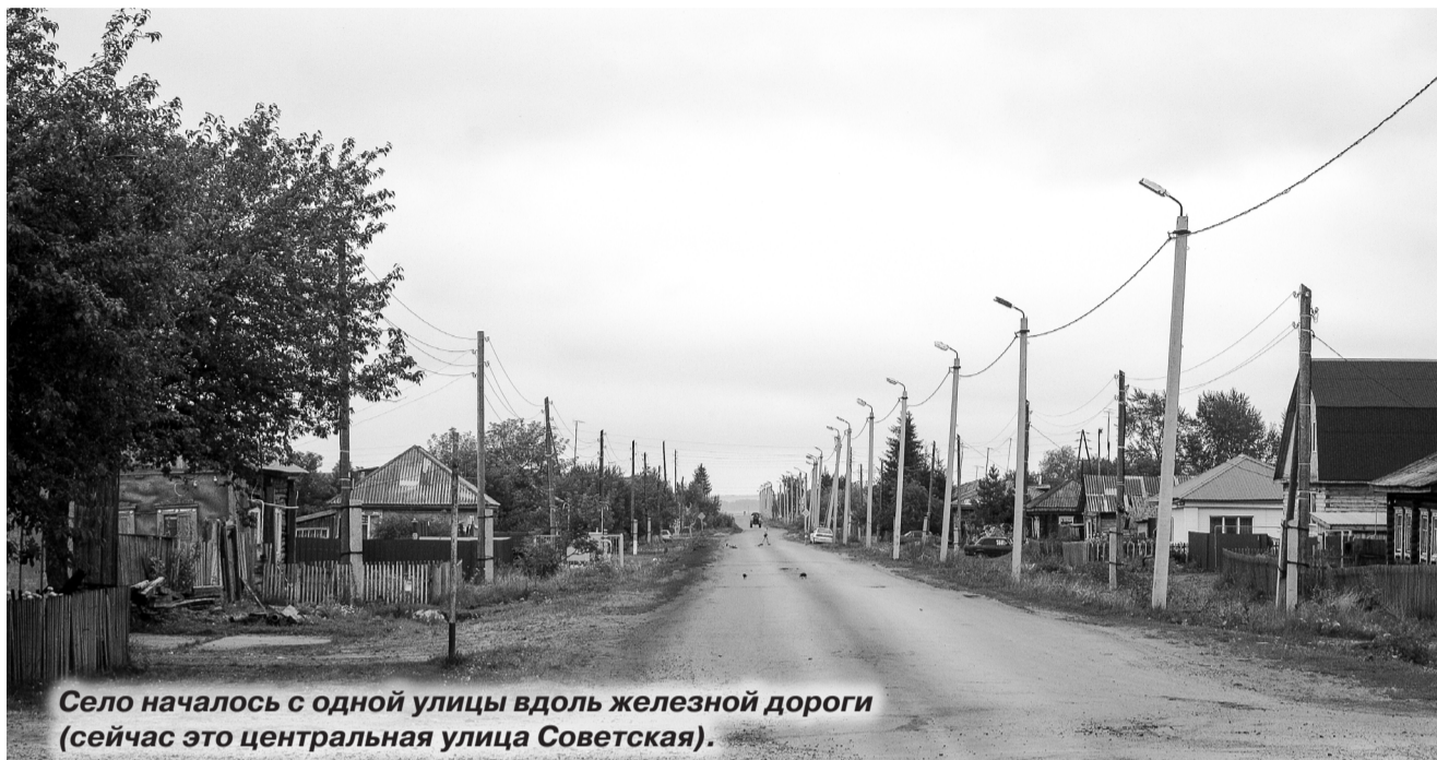
Село началось с одной улицы вдоль железной дороги (сейчас это центральная улица Советская).

На территории поселения работает Плешковская амбулатория, которая обслуживает населённые пункты Плешковского, Шаблыкского сельских поселений и д. Большой Остров. В ам-