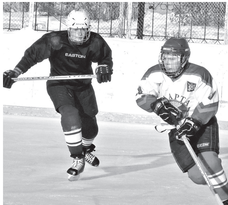
Страницу подготовила Ольга МЯСНИКОВА

...Учебный год в ДЮСШ заканчивается. Однако двери учреждения дополнительного образования не закроются: в дни школьных каникул здесь будет работать спортивный лагерь. Тренеры-преподаватели готовы принять летом полторы сотни мальчишек и девочек. Педагоги заранее подготовили для ребят специальные оздоровительные программы и индивидуальные планы тренировок.