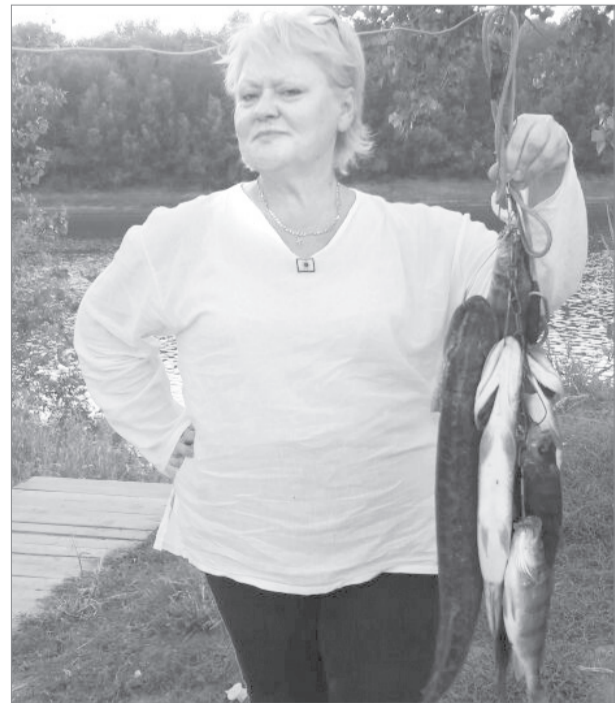
Такой улов считается богатым, но хочется большего. Мечта каждого рыбака - фото с гигантским сомом

Несколько лет назад они решили посмотреть местные красоты, и теперь четвертое лето подряд проводят здесь отпуск. В прошлом году добыли 40 килограмм сома, а нынче поймали