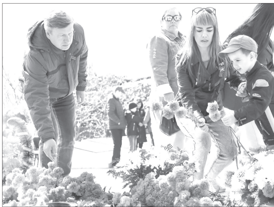
Возложение цветов на мемориально-духовном комплексе организовали по графику. В течение дня к памятнику приходили представители организаций, учреждений и предприятий Ялutorовска, жители и гости города

В память о героях. Среди зрителей, конечно, были родственники и