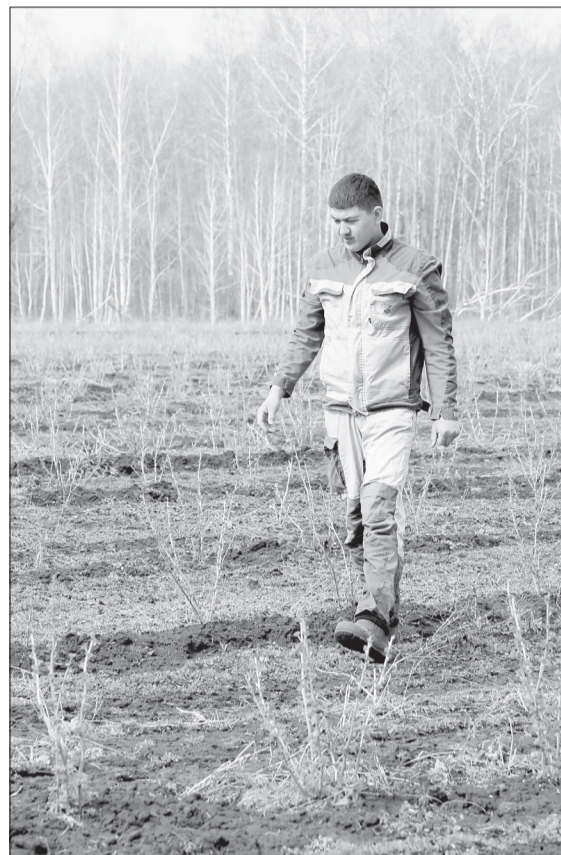
Предыдущие кусты чёрной смородины уже пошли в рост и летом дадут первые плоды