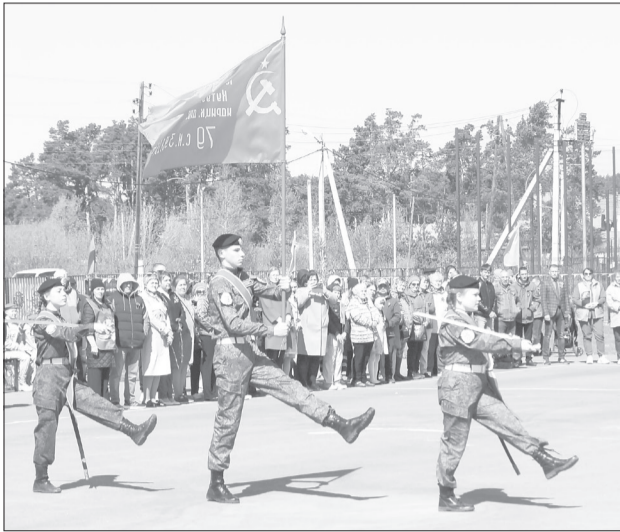
Копию Знамени Победы, которое в 1945 году водружали над Рейхстагом, на площадку внесли ребята из группы подготовки к военной службе «Патриот»