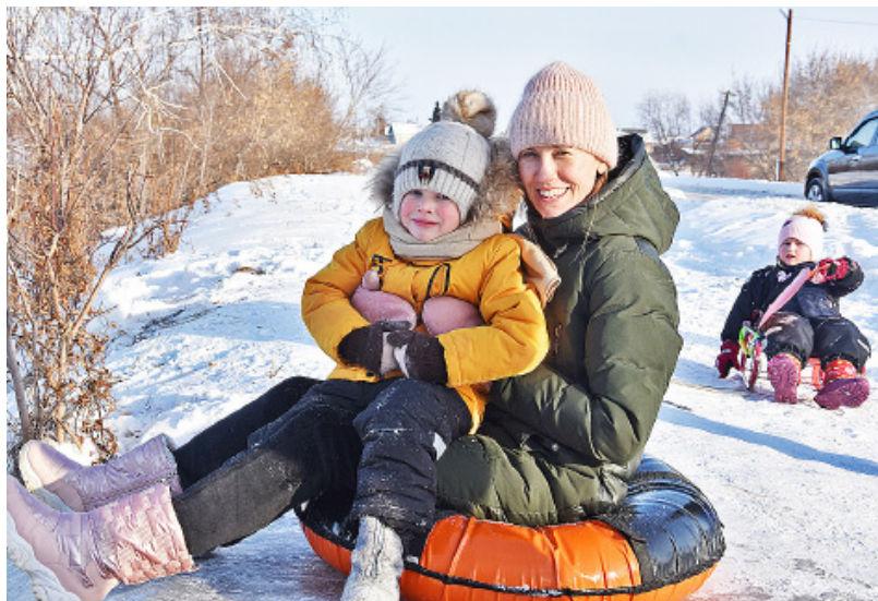
Пусть семейный досуг будет весёлым и полезным

6 января в 12 часов в Казанской спортивной школе состоится рождественский турнир по мини-футболу в рамках Декады спорта и здоровья, а в районной библиотеке пройдёт интерактивная игра «Литературный диктант». В 13 часов в детском спортивном комплексе «Медведь» будет показан мастер-класс «Новогодняя корзина», в 14 часов в районной библиотеке дети и подростки смо-