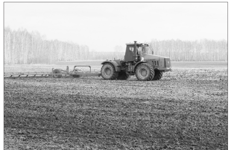
Боронование на абатских полях