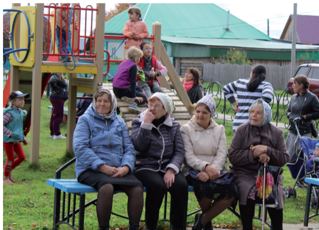
На праздник пришёл и стар и млад.