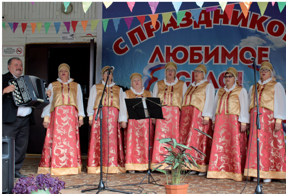
Вокальная группа «Калинка».