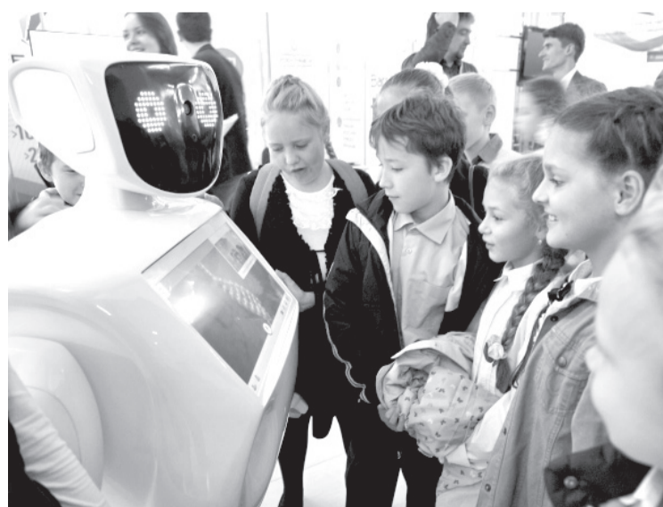
• Теперь роботов можно увидеть не только в кино.

Ольга МЯСНИКОВА