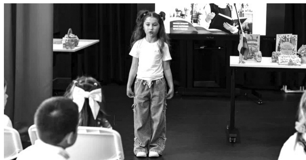
На снимке: Каждое выступление было пронизано искренней любовью к Родине