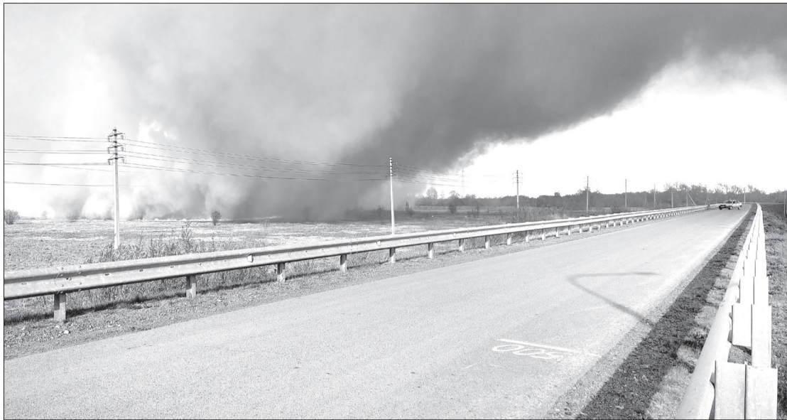
Огонь от Боровушки добрался до технологического проезда к автомобильному мосту через Тобол. Здесь возгорание удалось остановить