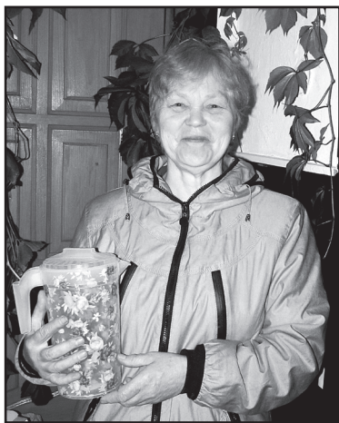
Участникам розыгрыша призы – моментально

для дома, для семьи. И всё, что немаловажно, российский производств. Вот так мы поддерживаем своего товаропроизводителя!