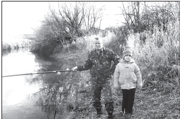
Внуки – продолжение рода Быковых

О. КОНОВАЛОВА