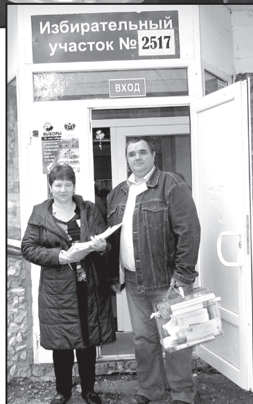
Возможность проголосовать есть у каждого

– Розыгрыш состоится после концертно-игровой программы, – уточняет она. – Среди призов – сушилка для овощей, блендер, термочайник, картины, вентилятор, шампуни, полотенца... чего только нет!