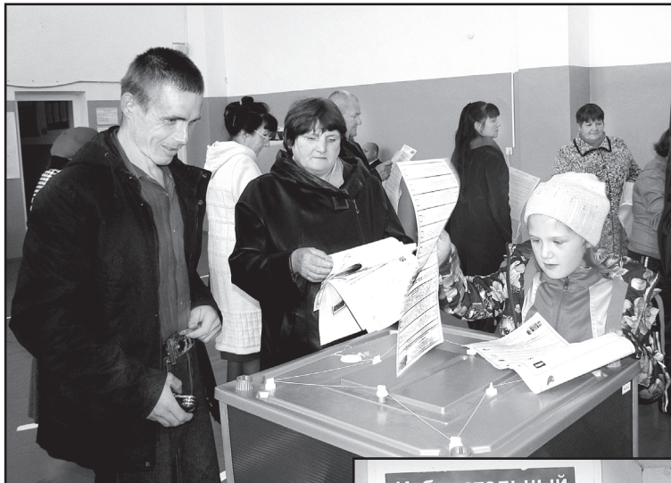
На избирательном участке № 2516