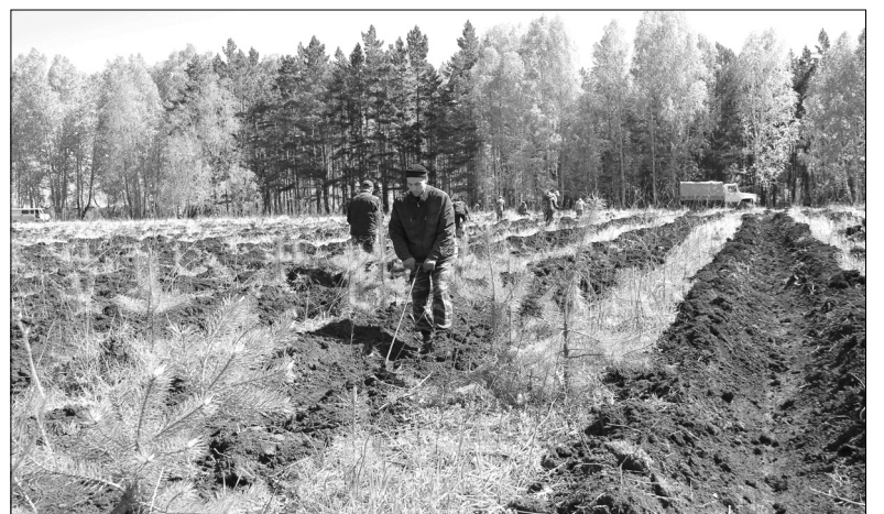
Голышмановские работники леса на трёх гектарах разместили более 13 тысяч двухлетних саженцев сосны обыкновенной в честь Всероссийского дня посадки леса