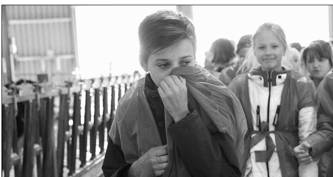
Первое «ароматное» впечатление пятиклассников от сельхозпроизводства

Наталья ГЛАДКОВСКАЯ.