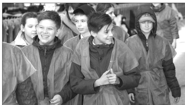
Второе впечатление: а здесь интересно! Может, пойдём сюда работать после школы?