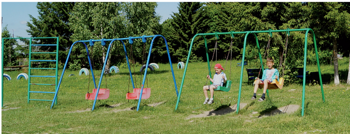
Детвора на каникулах