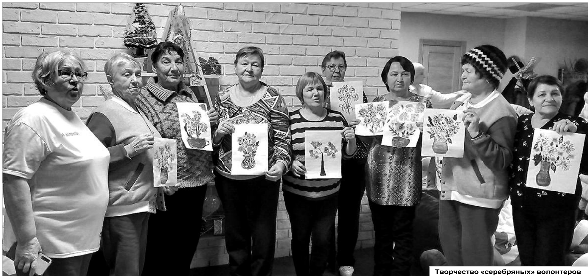
Творчество «серебряных» волонтеров