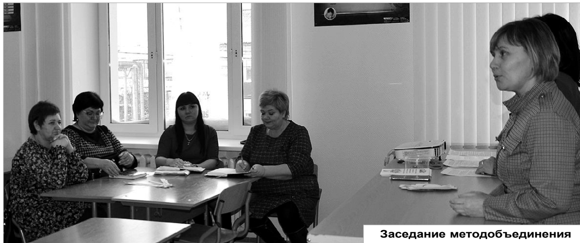
Заседание методического объединения