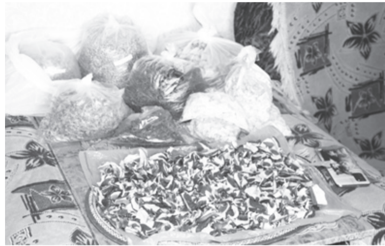
|| Сушёные овощи готовы к отправке