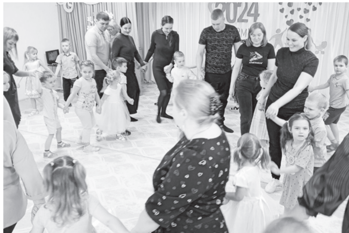
В завершение праздника родители и дети водили хоровод.

– В целях популяризации государственной политики в сфере защиты семьи, традиционных семейных ценностей указом президента Российской Федерации Владимира Путина 2024 год был объявлен Годом семьи в России. Во всех образовательных учреждениях нашей великой страны проводятся мероприятия, посвящённые открытию Года семьи. И наш детский сад не стал исключением и с огромным удовольствием поддержал эту идею.